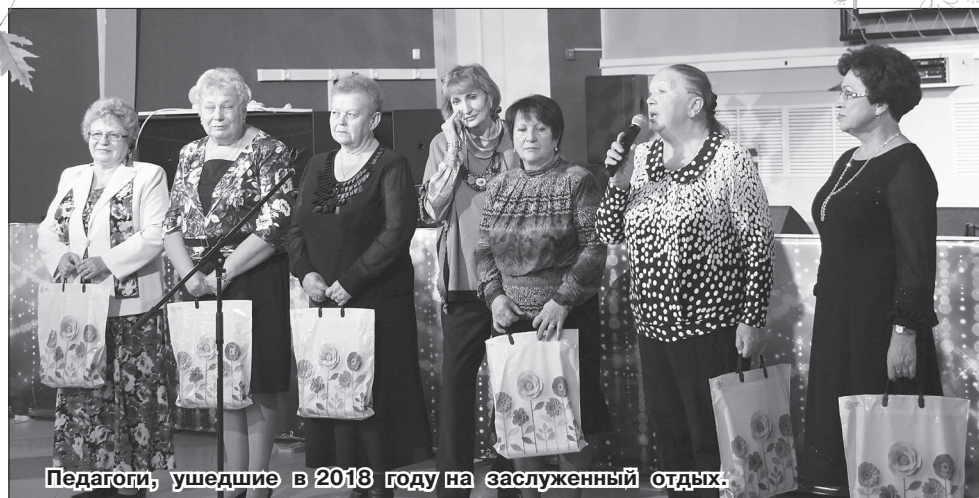
Педагоги, ушедшие в 2018 году на заслуженный отдых.

По традиции, в день профессионального праздника первыми получили поздравления и памятные сувениры молодые педагоги,