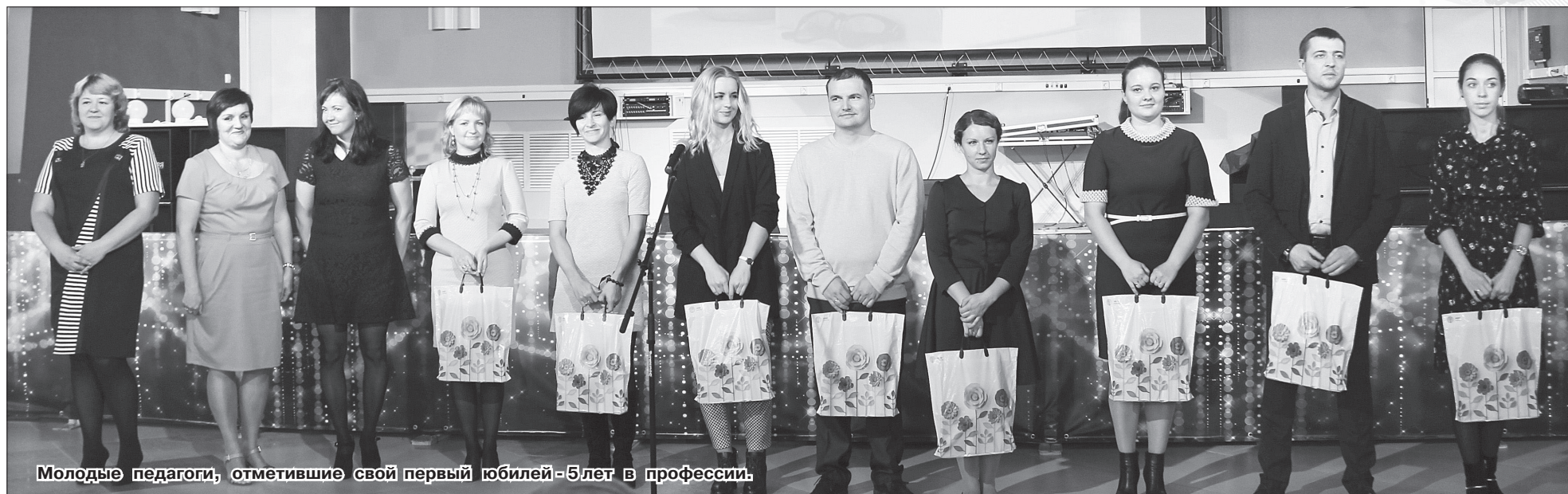
Молодые педагоги, отметившие свой первый юбилей - 5 лет в профессии.