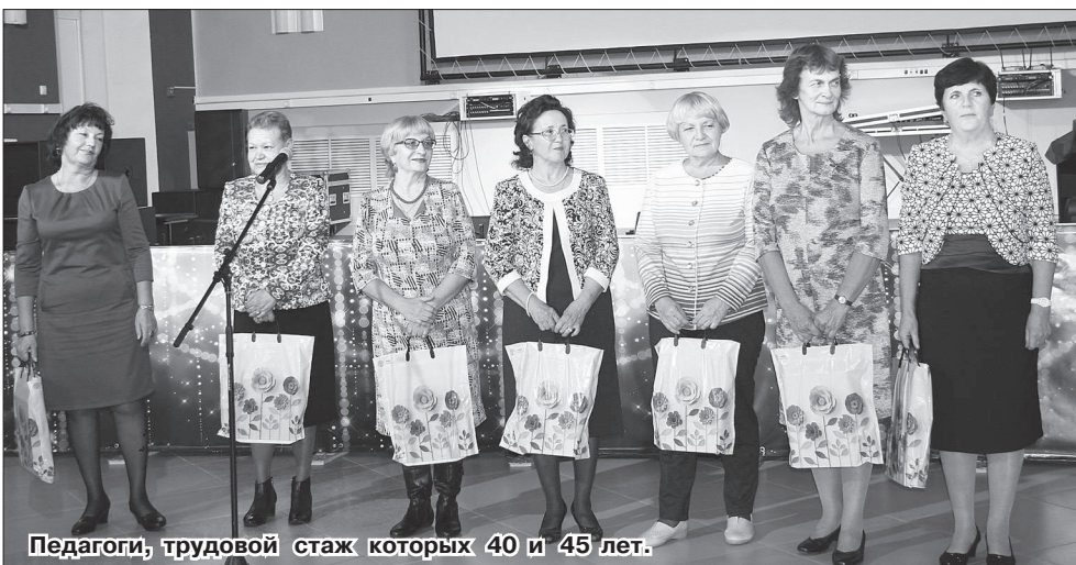
Педагоги, трудовой стаж которых 40 и 45 лет.

Педагогические работники собрались здесь, чтобы в уютной обстановке отдохнуть от повседневных забот, получить заряд хорошего настроения, поговорить по душам, поздравить коллег и самим принять поздравления.