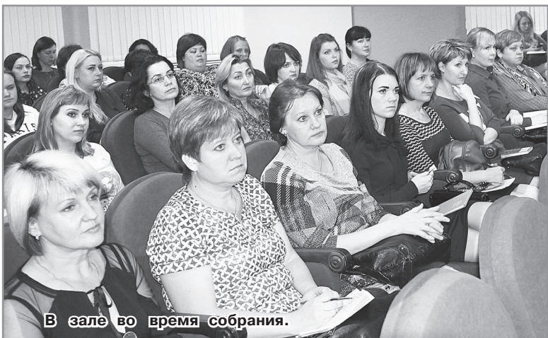
В зале во время собрания.

** мем (медиавирус) – это информация (не важно, текстовая ли, графическая ли, звуковая или оформленная в видеоролик), попавшая в резонанс с текущим душевным состоянием большого количества пользователей сети (либо значимой ее части). Запало в душу, что называется. Оставило след. Заставило этому подражать, совершенствоваться и тиражироваться.