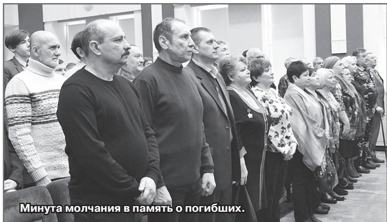
Минута молчания в память о погибших.