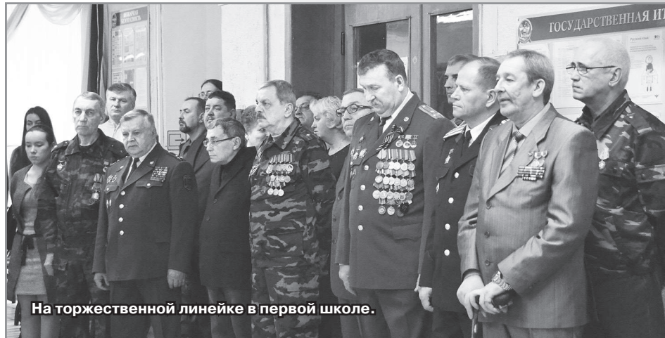
На торжественной линейке в первой школе.