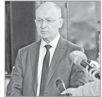
ФКП «ГЛП «Радуга».