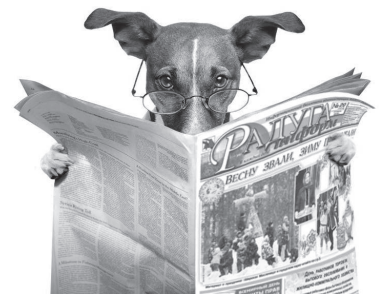
А. Торопова. Использованы материалы из открытых источников.

Вывод: если невозможно наказывать материально - воздерживаться морально. Не стесняться делать замечания владельцам собак, фиксировать случаи нарушения, выкладывать фото и видеофакты в социальные сети, воздействовать общественным порицанием. А главное - не мусорить самим. И ещё - было бы здорово, если бы собаки научились читать. Как разумные существа, они бы и сами не гадили, где попало, и хозяевам точно бы не позволили.