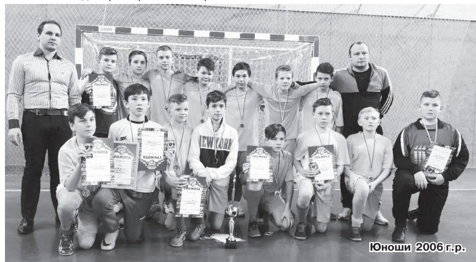
Юноши 2006 г.р.