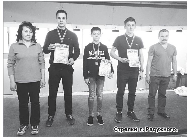
Стрелки г. Радужного.