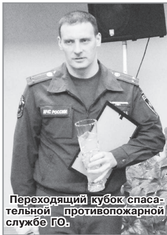
Переходящий кубок спасательной противопожарной службе ГО.

ного управления МЧС России по Владимирской области. В 2018 году обучены 45 человек.