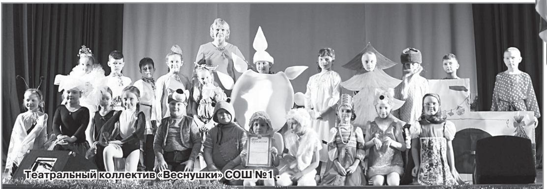
Театральный коллектив «Веснушки» СОШ №1.