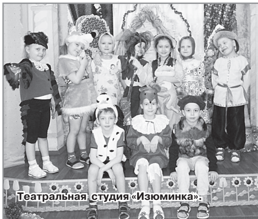
Театральная студия «Изоминка».