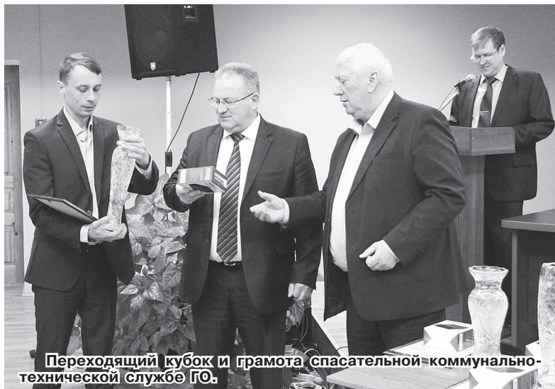
Переходящий кубок и грамота спасательной коммунально-технической службе ГО.

В числе основных задач на 2019 год: совершенствование системы управления, связи и оповещения города путем создания пунктов управления, оснащенных современными средствами связи, объединения всех экстренных служб в единую радиосеть, усовершен-