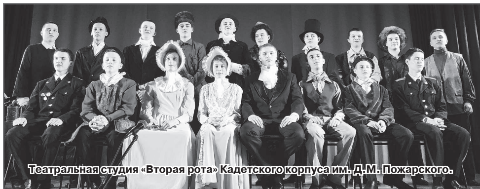
Театральная студия «Вторая рота» Кадетского корпуса им. Д.М. Пожарского.