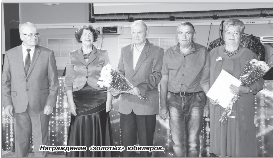
Награждение «золотых» юбиляров.