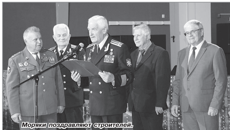
Моряки поздравляют строителей.

За большой личный вклад в строительство города Радужного, активное участие в общественной жизни