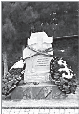
г. Судогда.