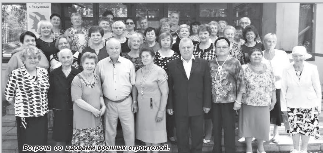
Встреча со вдовами военных строителей.