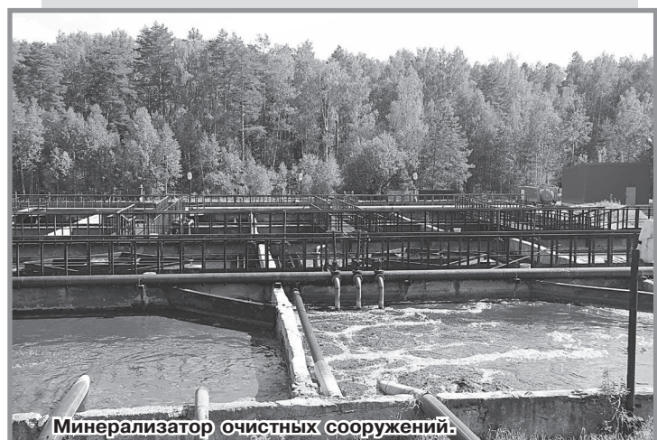
Минерализатор очистных сооружений.