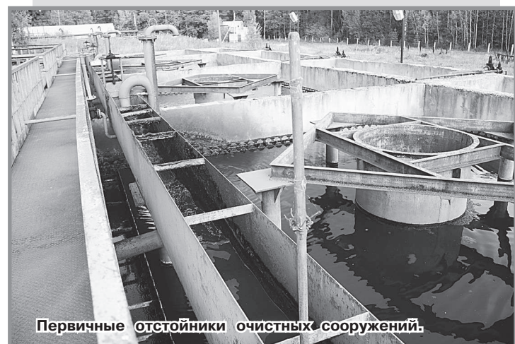
Первичные отстойники очистных сооружений.