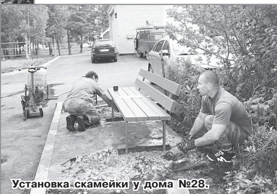
Установка скамейки у дома №28:

Долгожданный ремонт доставляет немало волнений жильцам. Они очень хотят, чтобы их придомовые территории преобразились, изменились в лучшую сторону, поэтому пристально следят за качеством