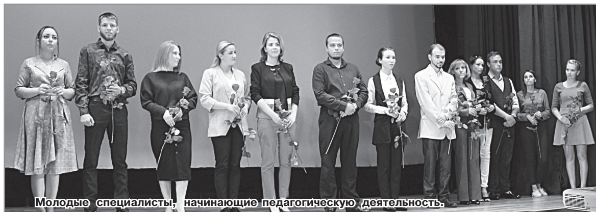
Молодые специалисты, начинающие педагогическую деятельность.