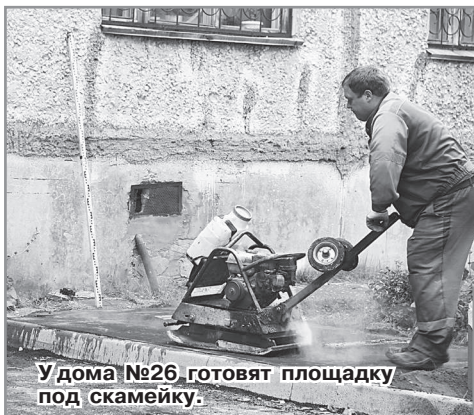
У дома №26 готовят площадку под скамейку.

В Радужном на 2019 год в программу «Формирование комфортной городской среды» включили ремонт дворовых территорий у четырёх домов первого квартала: № 15, № 26, № 27, № 28. Работы выполняются в соответствии с муниципальным контрактом ООО «Стройдорсервис». Согласно утверждённым дизайн-проектам обустройства дворовых территорий предусмотрено выполнение следующих видов работ: асфальтобетонное покрытие проезжей части, тротуаров, замена бортового камня, замена урн и лавочек.