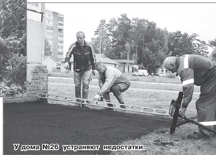
У дома №26 устраняют недостатки.

гами, по 300 рублей с квартиры получается, и такое качество? Требуем устранения недостатков!». Ну что ж, жильцы правы. Асфальт у домов раньше был как после бомбёжки. После дождя пройти невозможно, сплошные лужи. И вот – идёт долгожданный ремонт, но-