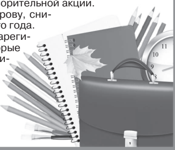
ГРАФИК ПРИЁМА ГРАЖДАН