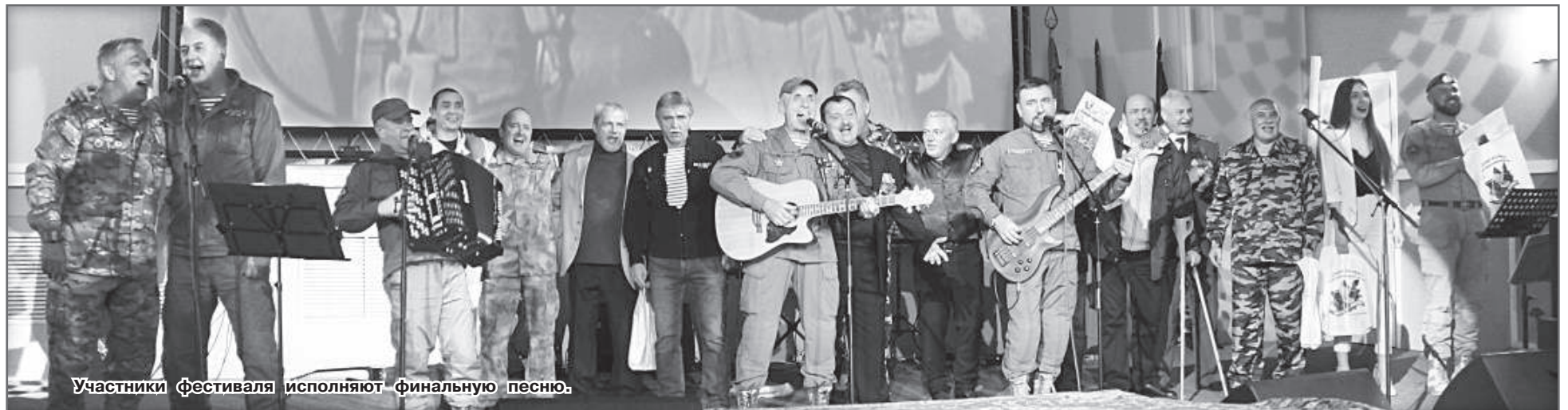
Участники фестиваля исполняют финальную песню.