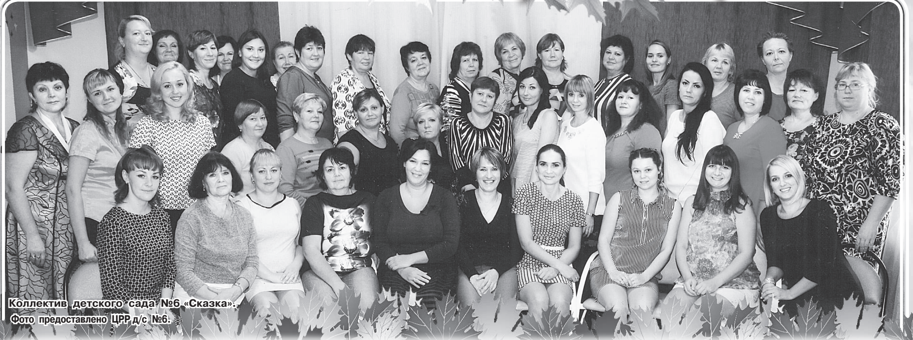
Коллектив детского сада №6 «Сказка».