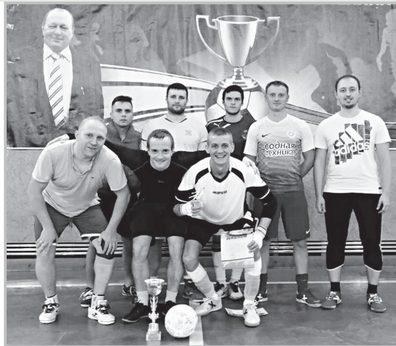
На фото: команда «Кристалл».