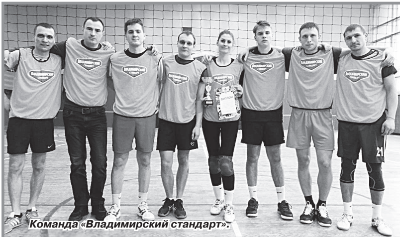
Команда «Владимирский стандарт».