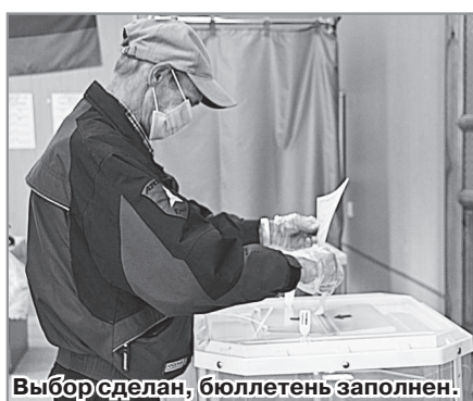
Выбор сделан, бюллетень заполнен.