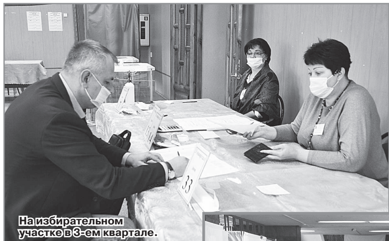
На избирательном участке в 3-ем квартале.

Жители 3 квартала и кварталов 7/1, 7/2 голосовали на избирательных участках №№ 498, 500 и 501, которые располагаются в здании третьего домоуправления и в СОШ №2.