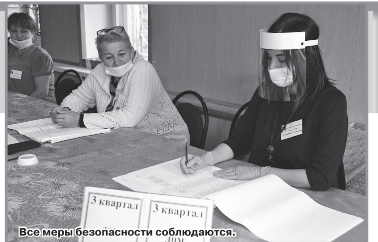
Все меры безопасности соблюдаются.

На выходе из избирательных участков радужан, принявших участие в голосовании, встречали представители Всероссийского