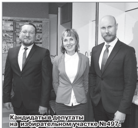
Кандидаты в депутаты на избирательном участке №497.

Как рассказали члены избирательной комиссии, на дому проголосовали в этот день 25 человек. Как никогда много (7 человек) на участке присутствовало в этот день представителей от кандидатов и партий - наблюдателей и членов УИК с правом совещательного голоса. Можно здесь было видеть и самих кандидатов в депутаты, в хорошем, приподнятом настроении, но, конечно, немного волнующихся.