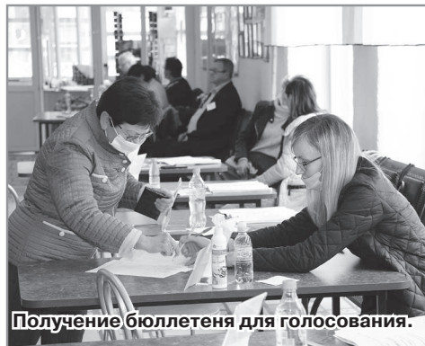
Получение бюллетеня для голосования.

Как же проходило голосование, как голосовали радужане?