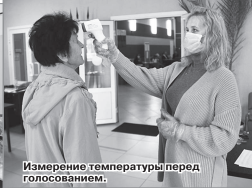
Измерение температуры перед голосованием.

На выборы я хожу всегда, считаю, что это правильно. Тем более важно участвовать в нынешних выборах в СНД. Ведь мы выбираем депутатов, которые будут работать на благо всех горожан. Всем нам хочется жить лучше, и мы надеемся, что из-