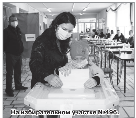
На избирательном участке №496.

Родители со своими детьми с удовольствием приняли участие во всех мероприятиях. Однако, главным событием в этот день в Радужном стали всё же выборы депутатов в Совет народных депутатов.