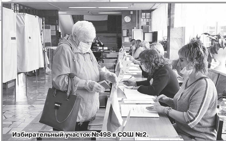
Избирательный участок №498 в СОШ №2.

На всех избирательных участках дежурили в течение всего дня голосования наблюдатели от партий и кандидатов. К моменту посещения избирательных участков представителями городских СМИ претензий и замечаний по ходу выборов у наблюдателей не было.