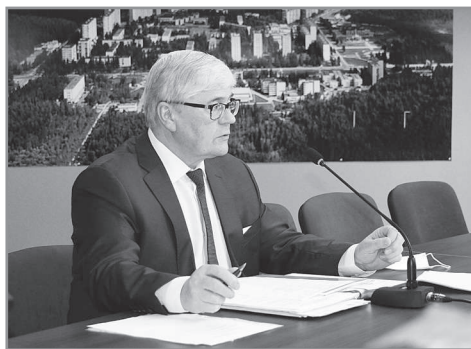
Во вторник, 22 сентября состоялось первое заседание Совета народных депутатов ЗАТО г. Радужный седьмого созыва.