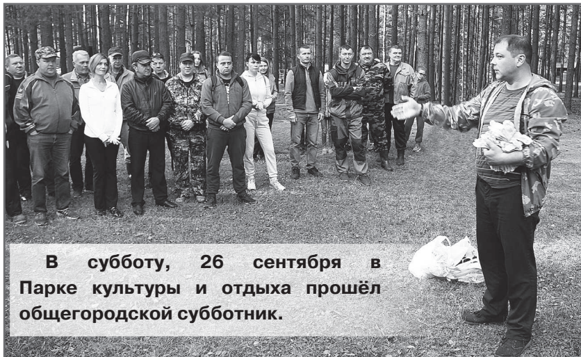
В субботу, 26 сентября в Парке культуры и отдыха прошёл общегородской субботник.

Погода в этот день стала настоящим подарком для тех, кто пришёл в парк. Тепло, сухо, солнечно - что может быть лучше для общественно-полезной деятельности на свежем воздухе. К девяти часам утра на площадке возле аттракционов собрались жители нашего города, представители управления образования, юридического отдела городской администрации, учреждений культуры и спорта, МКУ «ГКМХ», МКУ «Дорожник», МКУ «УАЗ», МУП «АТП», сотрудники СПСЧ №2, а также юные волонтеры. Всего в субботнике приняли участие порядка 50 человек.