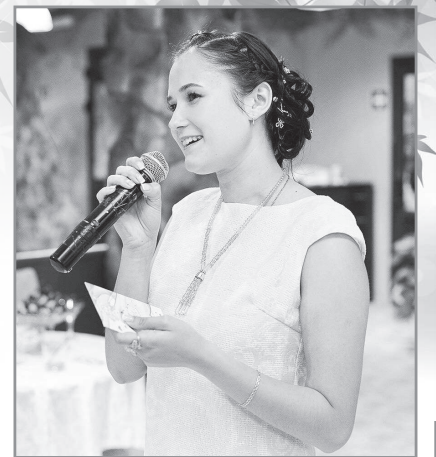
Администрация ЦВР «Лад».

Ребята, приходите в студию эстрадного вокала ЦВР «Лад», мы вас ждём!