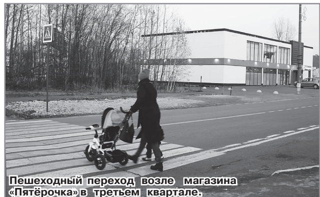
Пешеходный переход возле магазина «Пятёрочка» в третьем квартале.

Размещение дополнительного пешеходного перехода в указанном месте противоречит нормам размещения пешеходных переходов на расстоянии 200-300 м друг от друга в соответствии с ГОСТ Р 52766-2007, а также противоречит требованиям обеспечения безопасности дорожного движения, так как он будет размещен за автобусной остановкой по направлению движения автобуса».