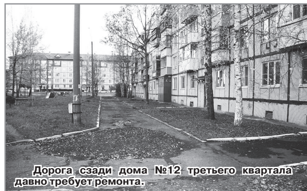
Дорога сзади дома №12 третьего квартала давно требует ремонта.

Проведение работ по благоустройству дворовых территорий также возможно в рамках реализации государственной программы «Благоустройство территорий муниципальных образований Владимирской области», при условии выделения субсидий из областного бюджета на финансирование мероприятий по благоустройству дворовых территорий города и при условии финансового участия граждан. Постановлением администрации ЗАТО г. Радужный Владимирской области от 06.10.2017г. № 1543 утверждён Порядок предоставления, рассмотрения и оценки предложений заинтересованных лиц о включении дворовой территории в муниципальную подпрограмму «Формирование комфортной городской среды» муниципальной программы «Дорожное хозяйство и благоустройство ЗАТО г. Радужный Владимирской области» (далее - Порядок).