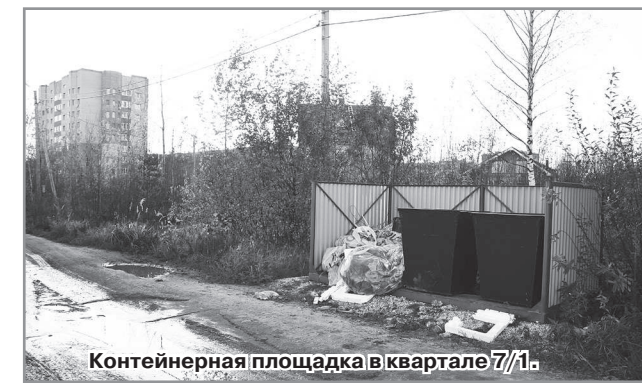
Контейнерная площадка в квартале 7/1.

Председатель ГСК-6 26 октября по «прямому телефону» посетовал на то, что застройщики квартала 7/1 накопительный, строительный мусор складывают в мусорные контейнеры ГСК-6. По его мнению, необходимо наладить работу по установке мусорных контейнеров для застройщиков квартала 7/1 и обязать их заключить договора на вывоз мусора.