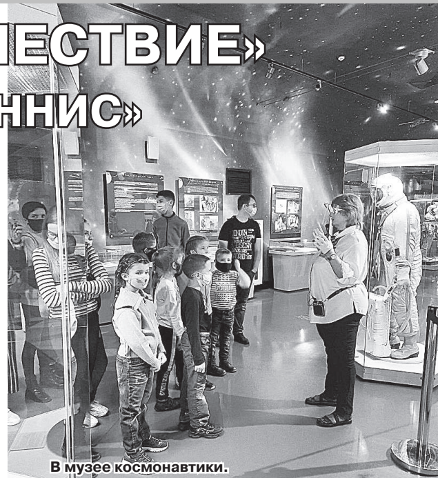
В музее космонавтики.

От 26 детей и 20 родителей участников проекта «Радуга-Семья», в рамках которого смогла состояться эта замечательная по-