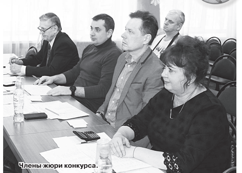
Члены жюри конкурса.