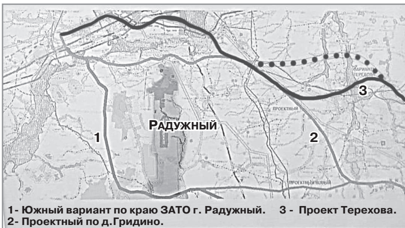
1 - Южный вариант по краю ЗАТО г. Радужный. 2 - Проектный по д. Гридино. 3 - Проект Терехова.