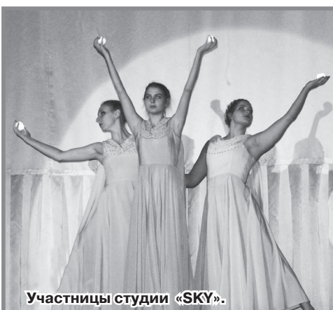
Участницы студии «SKY».

Эта история, в которой переплелись 2020-й и 1942-й годы, дополнялась хорошо подобранными вокальными и танцевальными композициями. Олег Матвеев с чувством исполнил песню «С чего начинается Родина».