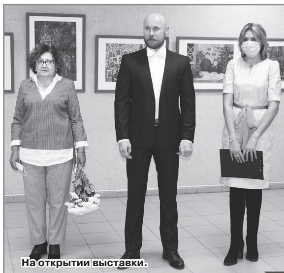
На открытии выставки.

В связи со сложившейся эпидемиологической ситуацией, в этом году Неделя культуры и спорта не такая масштабная, как обычно. Мероприятий в разы меньше. И на открытии Недели народу в «Досуге» было не так много, вход был по пригласительным билетам, рассаживались зрители на расстоя-