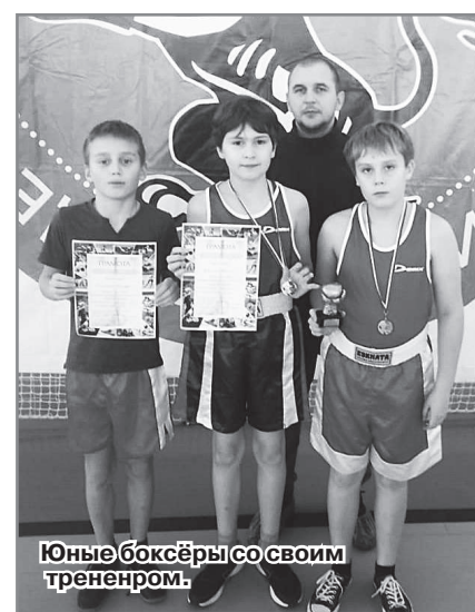
Юные боксёры со своим тренером.

Администрация ДЮСШ.