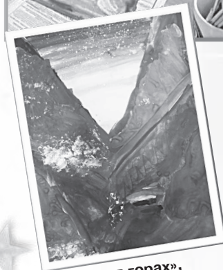
«Закат в горах», Варвара Бабина.