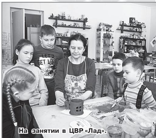
На занятии в ЦВР «Лад».