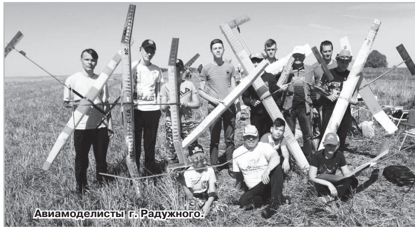
Авиамodelьисты г. Радужного.