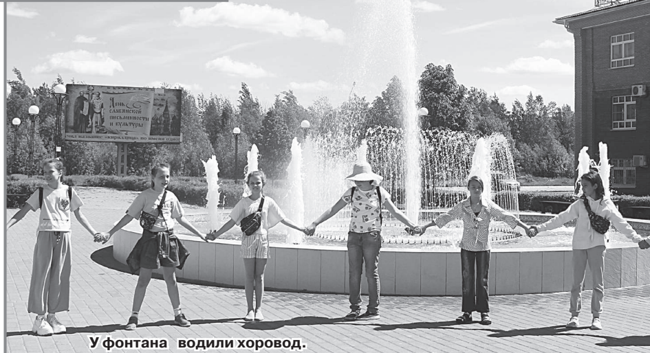
У фонтана вели хоровод.