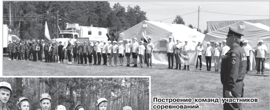
Построение команд участников соревнований.

При прохождении этапов «Маршрута выживания» команду