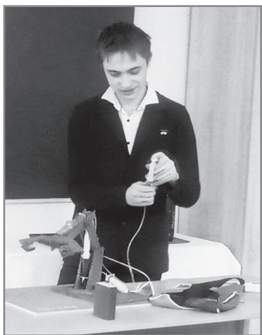
-мобильное приложение «Лёгкая одежда» («Easy Clothes»), которое позволит решить проблему

Среди идей: виртуальная картинная галерея, посещение которой даст возможность людям познакомиться с творчеством известных художников, не выходя из дома: рассмотреть картины с разных углов и под различным освещением, увеличить мелкие фрагменты;