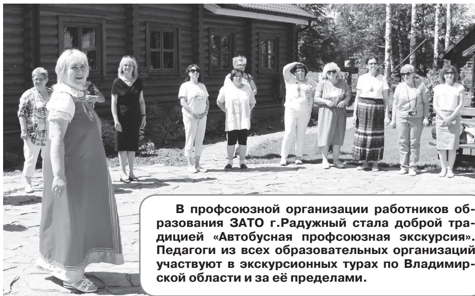
В профсоюзной организации работников образования ЗАТО г.Радужный стала доброй традицией «Автобусная профсоюзная экскурсия». Педагоги из всех образовательных организаций участвуют в экскурсионных турах по Владимирской области и за её пределами.

Позади очередной учебный год. За окном лето, июнь, и работники образовательных учреждений нашего города отправились на Ярославскую землю, в туристический комплекс «Соляной остров».