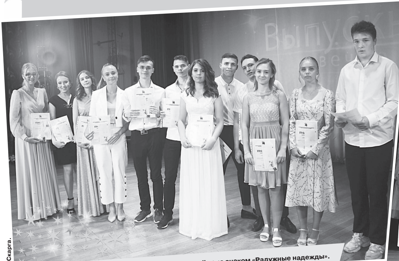
Выпускники 11 «А» класса СОШ №1, награждённые знаком «Радужные надежды».

На прошлой неделе в КЦ «Досуг» прошли выпускные вечера для одиннадцатиклассников первой и второй школ. Выпускникам вручили аттестаты, в их адрес прозвучало много тёплых слов и добрых напутствий.