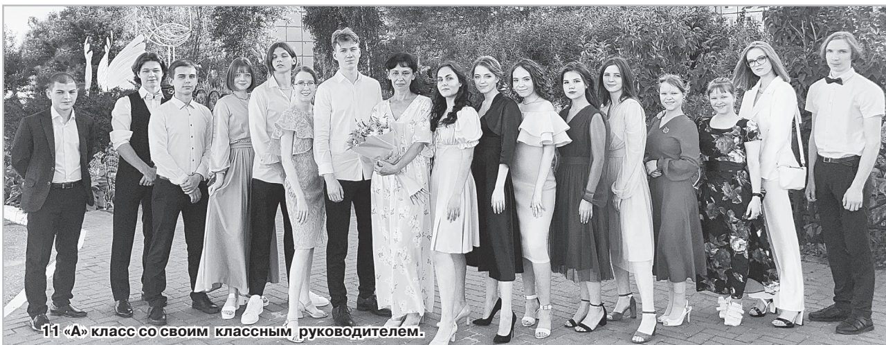
11 «А» класс со своим классным руководителем.