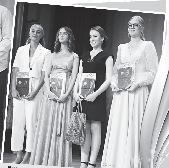
Выпускницы 11 «А» класса СОШ №1, получившие аттестаты с отличием.

Материалы о выпускных вечерах читайте на стр. 4, 5.