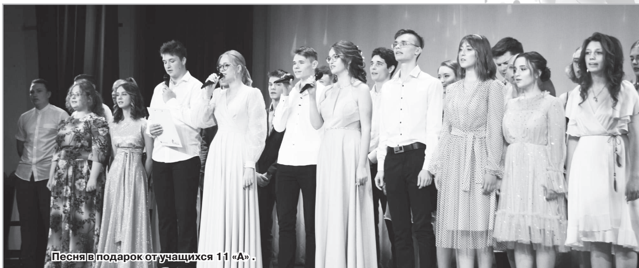
Песня в подарок от учащихся 11 «А».