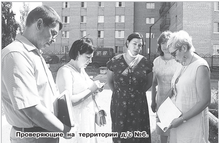
Проверяющие на территории д/с №6.

Во вторник, 10 августа прошёл первый этап проверки готовности образовательных учреждений к новому учебному году 2021-2022 году. В этот день проверку прошли детский сад №3, ЦВР «Лад», стрелковый тир, детский сад №6, ДЮСШ и ДШИ.