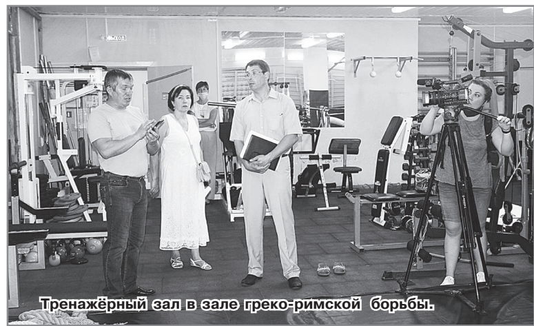
Тренажёрный зал в зале греко-римской борьбы.

- В нашем учреждении проведены косметические ремонты в нескольких группах, устранили и закрасили небольшие трещины