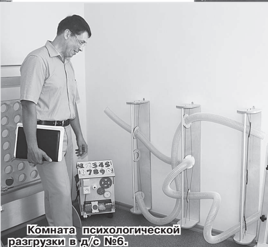
Комната психологической разгрузки в д/с №6.

Комиссия осмотрела группы, помещения, используемые под дополнительные занятия, комнату психологической разгрузки. Современные сады удивляют при каждом новом посещении. В этот раз посмотрели в комнате психологической разгрузки очень интересное оборудование, например, машину для обнимания, кольцо с разноцветными лентами, это место для уединения,