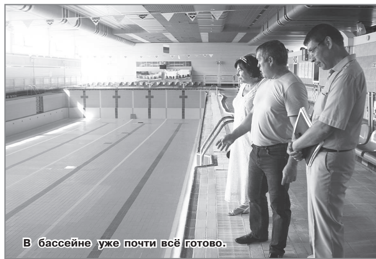
В бассейне уже почти всё готово.

В Детско-юношеской спортивной школе тоже подготовительные работы близятся к завершению. Ни больших, ни малых ремонтов в летнее время не проводилось,