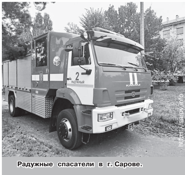
Радужные спасатели в г. Сарове.

Если в Радужном обстановка с лесными пожарами более-менее стабильная, то в других регионах России из-за жаркого засушливого лета она совсем неблагоприятная. Пожарные ФГКУ «Специального управления ФПС №66 МЧС России» оказывают помощь в соседней Нижегородской области, где горят леса на территории Мордовского заповедника. Из заповедника огонь подступает к закрытому территориальному образованию Саров, где располагается Всероссийский ядерный центр - РФЯЦ-ВНИИЭФ, там из-за ситуации с пожаром с 19 августа введен режим ЧС.