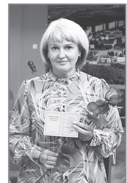
И. Митрохина.