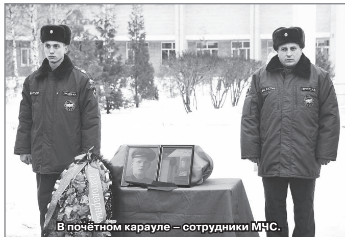
В почётном карауле – сотрудники МЧС.