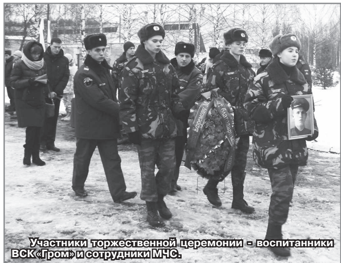
Участники торжественной церемонии - воспитанники ВСК «Гром» и сотрудники МЧС.