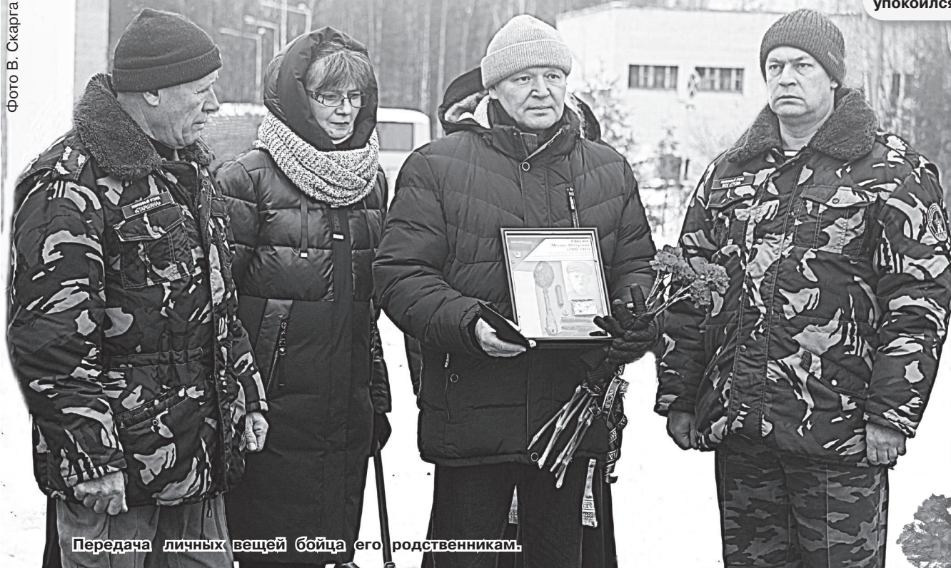
Передача личных вещей бойца его родственникам.