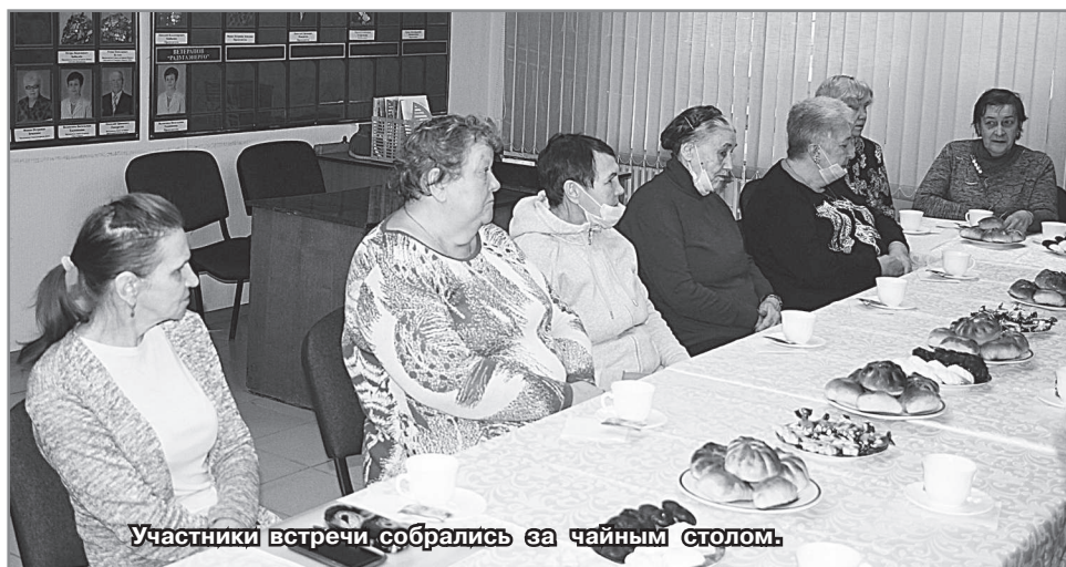
Участники встречи собрались за чайным столом.