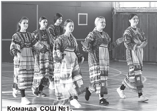
Команда СОШ №1.