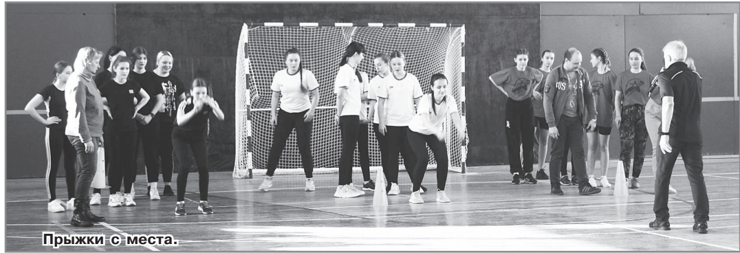
Прыжки с места.