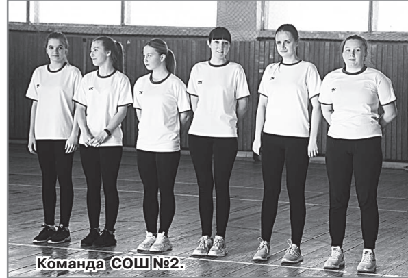
Команда СОШ №2.

Девушки из второй школы уверенно лидировали в большинстве конкурсов. После азартных сорев-