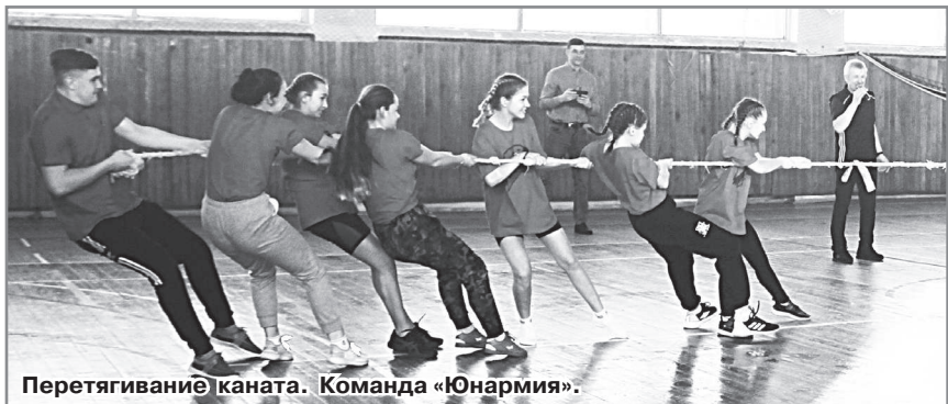
Перетягивание каната. Команда «Юнармия».