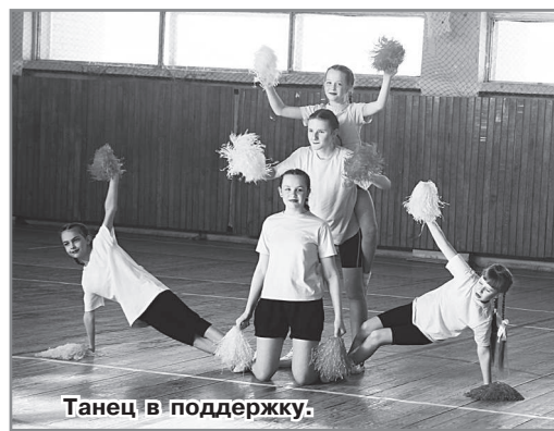
Танец в поддержку.