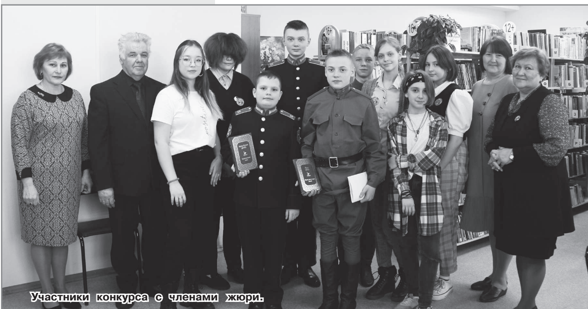
Участники конкурса с членами жюри.