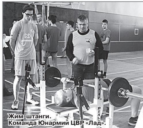
Жим штанги. Команда Юнармии ЦВР «Лад».