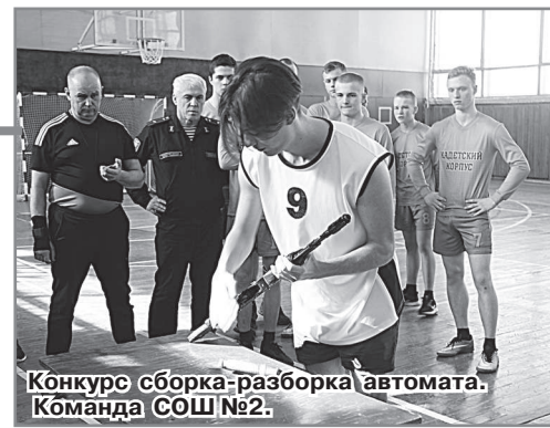
Конкурс сборки-разборки автомата. Команда СОШ №2.