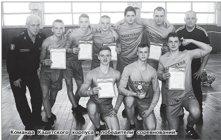
Команда Кадетского корпуса - победители соревнований.