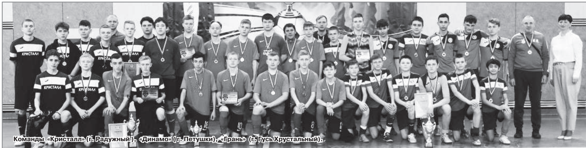
Команды «Кристалл» (г. Радужный), «Динамо» (г. Петушки), «Грань» (г. Гусь-Хрустальный).

На базе спортивного зала Детско-юношеской спортивной школы 12 и 13 марта проходили игры Кубка Ассоциации мини-футбола «Золотое кольцо» среди юношей 2006 года рождения.