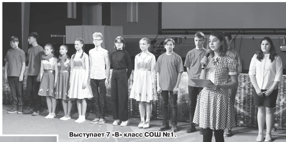
Выступает 7 «В» класс СОШ №1.

Перед началом выступлений классов динамичную композицию под бурные аплодисменты зрителей исполнили участницы объединения «Черлидинг» ЦВР «Лад» (руководитель О.Ю. Феофанова). А затем, сменяя друг друга, свои визитные карточки и видеоролики демонстрировали зрителям и членам жюри классы-участники - наверное, самые сплочённые и дружные из всех классов своих