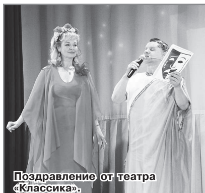
Поздравление от театра «Классика».

Затем прошла церемония награждения руководителей творческих объединений и всего коллектива КЦ «Досуг».