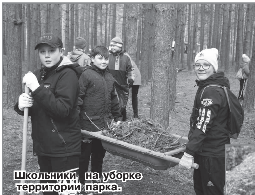
Школьники на уборке территории парка.

вой зоне, не мусорить в неположенных местах.