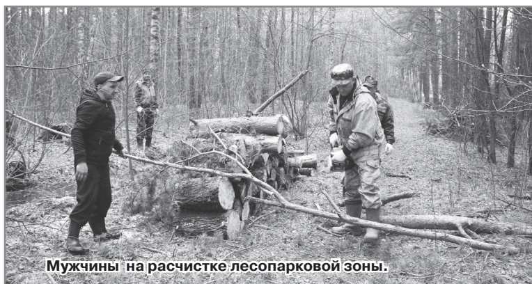
Мужчины на расчистке лесопарковой зоны.