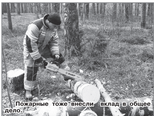
Пожарные тоже внесли вклад в общее дело.