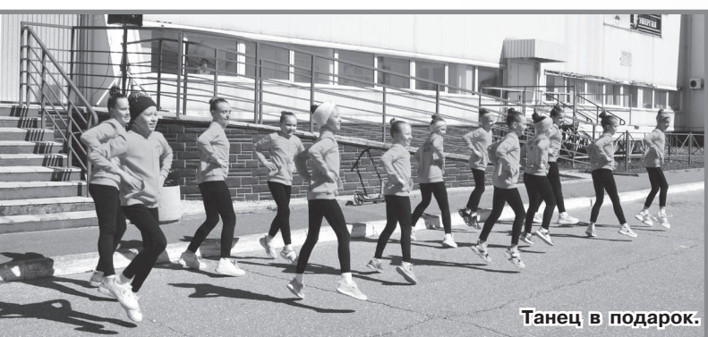
Танец в подарок.