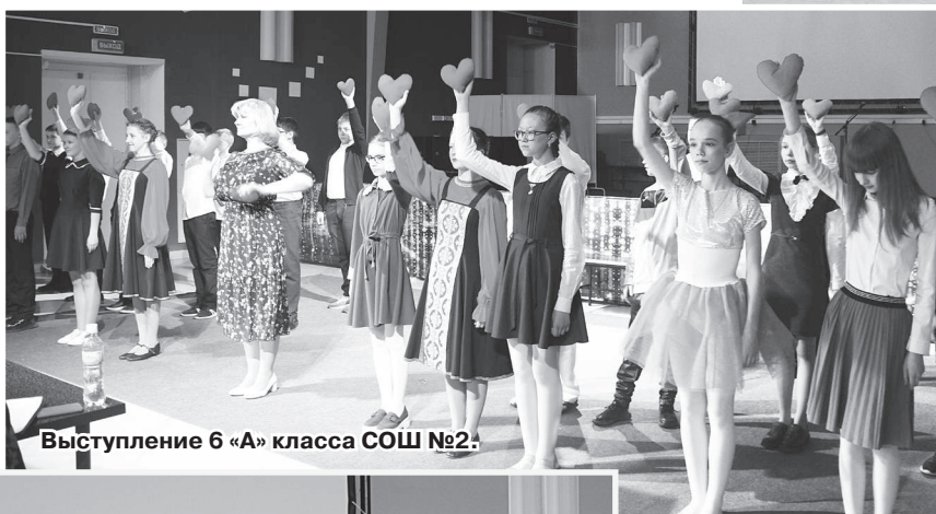
Выступление 6 «А» класса СОШ №2.