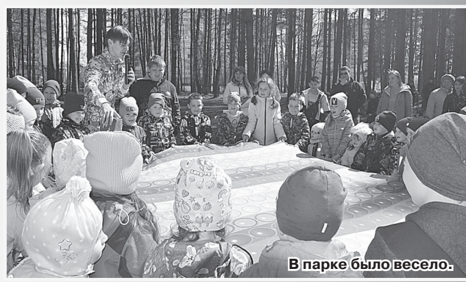
В парке было весело.