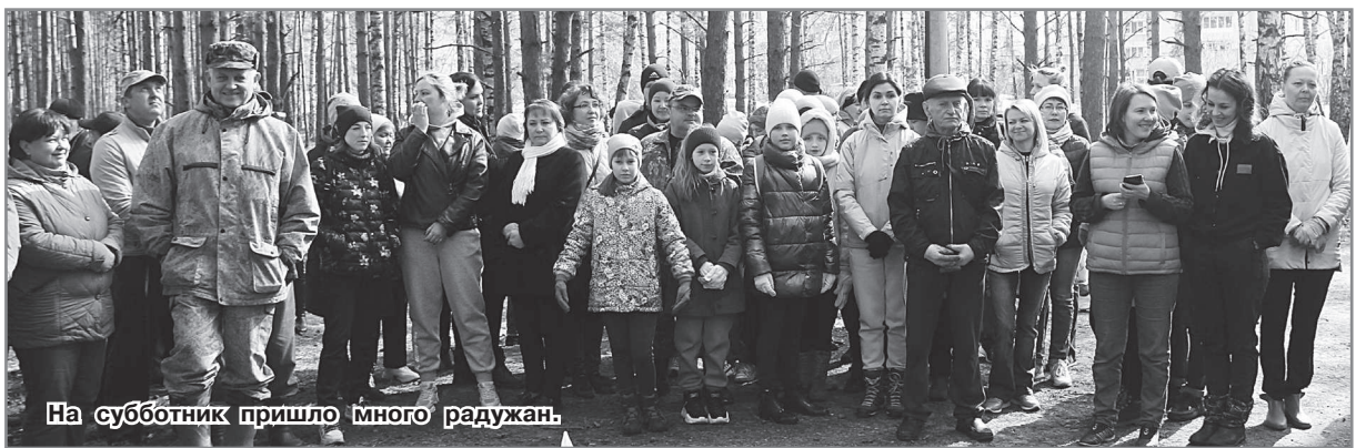
На субботник пришло много радужан.

В этот день работа велась и на близлежащих к парковой зоне территориях. Несколько мужчин из МКУ «УАЗ», МУП «ЖКХ», МУП «АТП», а также зам. главы администрации ЗАТО г. Радужный по социальной