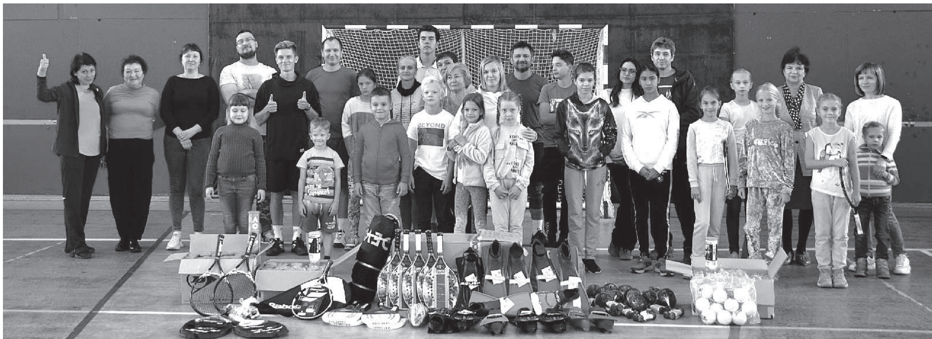
Фото предоставлены автором.