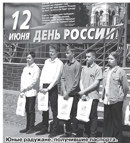
Юные радужане, получившие паспорта.