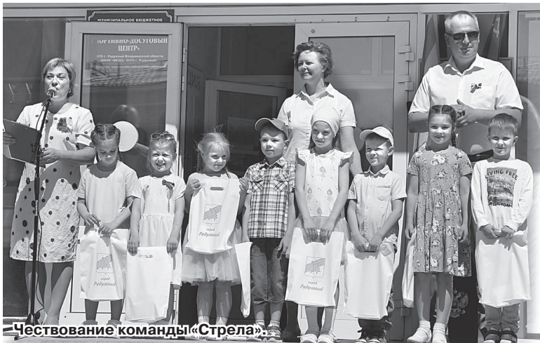
Чествование команды «Стрела».