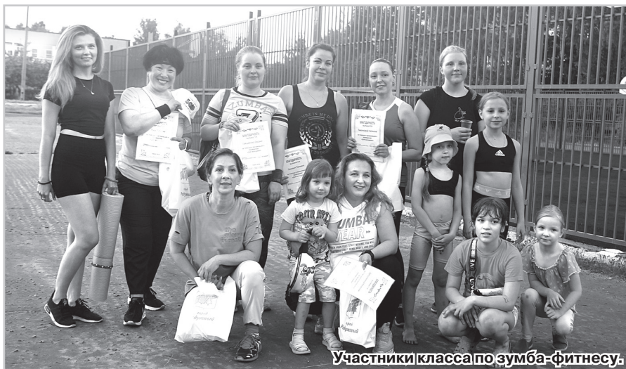
Участники класса по зумба-фитнесу.