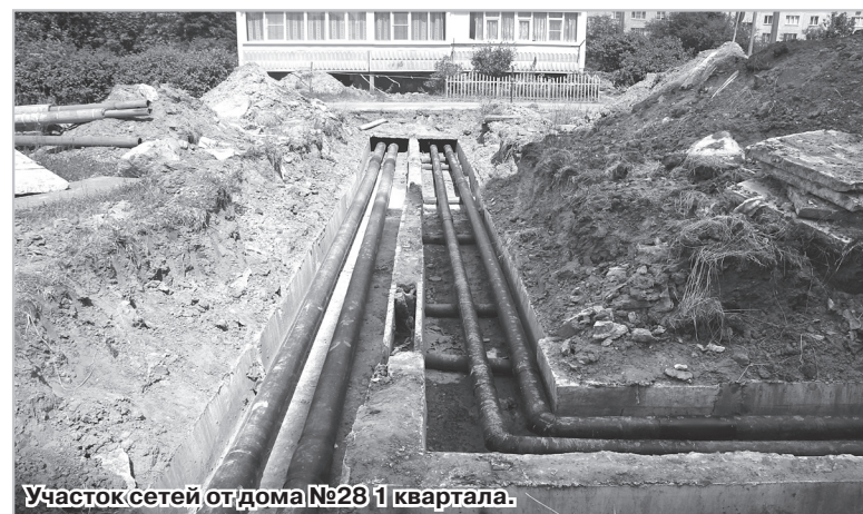
Участок сетей от дома №28 1 квартала.