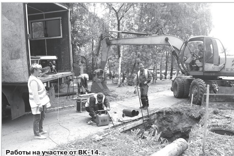
Работы на участке от ВК-14.