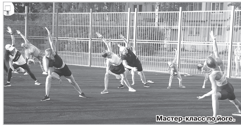
Мастер-класс по йоге.