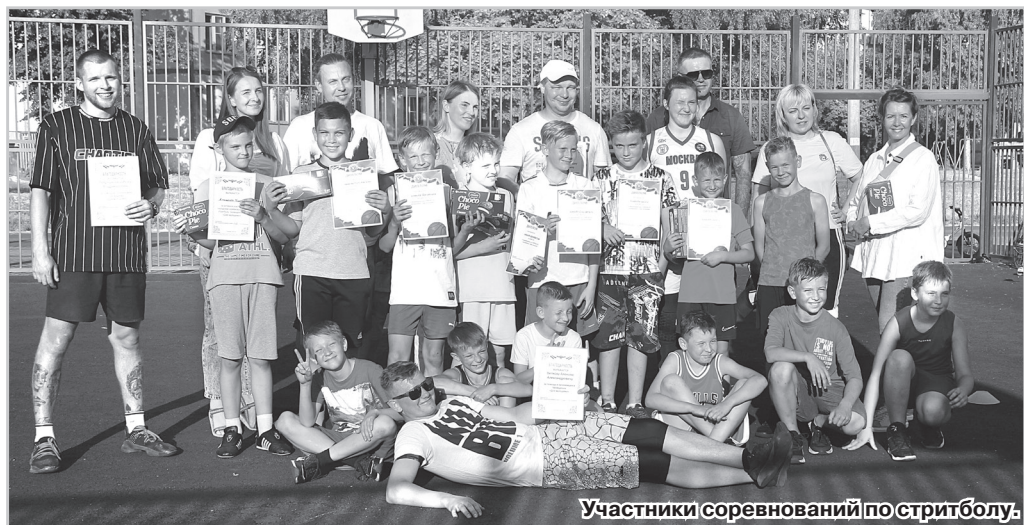
Участники соревнований по стритболу.