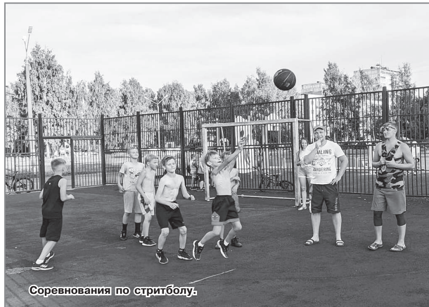
Соревнования по стритболу.

А. Торопова.