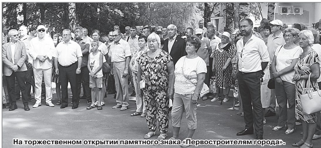
На торжественном открытии памятного знака «Первостроителям города».