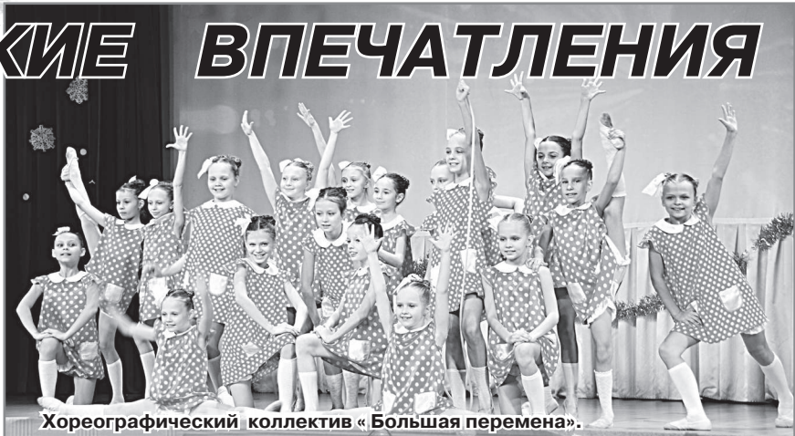
Хореографический коллектив «Большая перемена».

В завершении руководители хореографического ансамбля «Содружество», которые стали главными организаторами этого танцевального праздника, со сцены поблагодарили приглашённые коллективы и, руководствуясь принципом «на других посмотреть, себя показать», высказали пожелание на дальнейшее плодотворное сотрудничество.