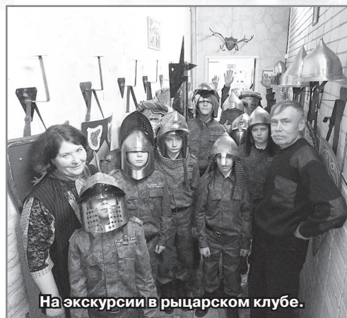
На экскурсии в рыцарском клубе.

Запоминающимися мероприятиями стали премьерный спектакль театральной студии «Юные дарования» «Небесный корабль» о Януше Корчаке; презентация поэтического