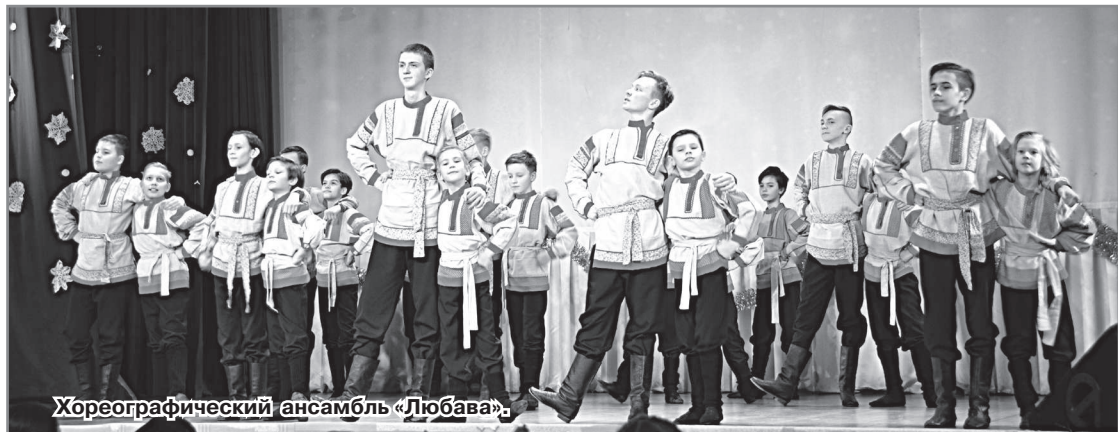
Хореографический ансамбль «Любава».