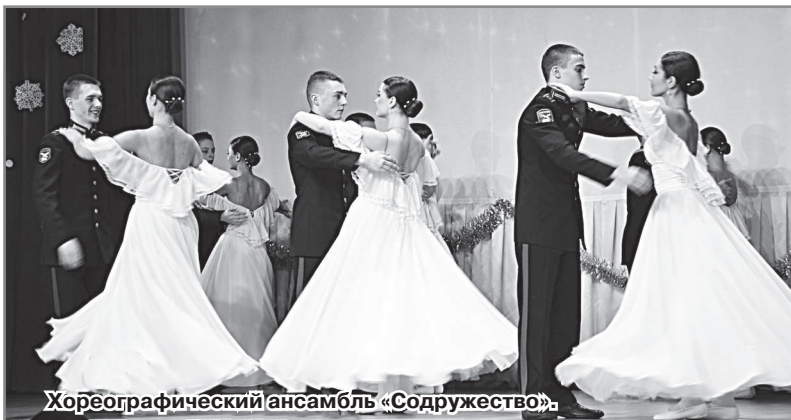
Хореографический ансамбль «Содружество».

Д. Свешникова, художественный руководитель КЦ «Досуг».