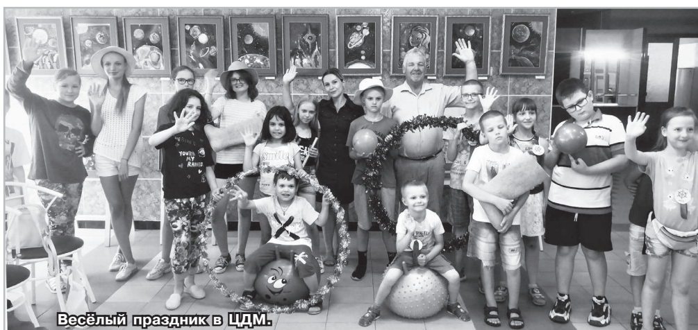
Весёлый праздник в ЦДМ.

Администрация ЦДМ.