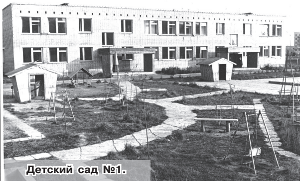
Детский сад №1.

Для надёжного обеспечения посёлка и технологических площадок предприятия холодной водой строилась станция третьего подъёма.