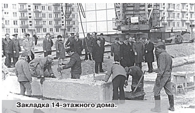
Закладка 14-этажного дома.

К 1980 году в жилом городке стояло 20 жилых домов, в которых проживали 5,5 тысяч человек. Был построен и введён в действие продовольственный магазин, магазин хлебобу-