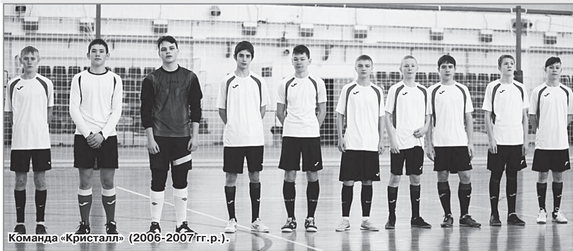
Команда «Кристалл» (2006-2007 г.р.).

В Ярославле 18-20 января прошли 3-5-й туры Первенства Ассоциации мини-футбола «Золотое кольцо» среди юношей 2006-2007 г.р. Команда «Кристалл» г. Радужного провела 6 игр, в которых показала следующие результаты: ничья с командами из г. Конаково, Вологды, Гусь-Хрустального и Ярославля, две победы над командами из Москвы и Ярославля.