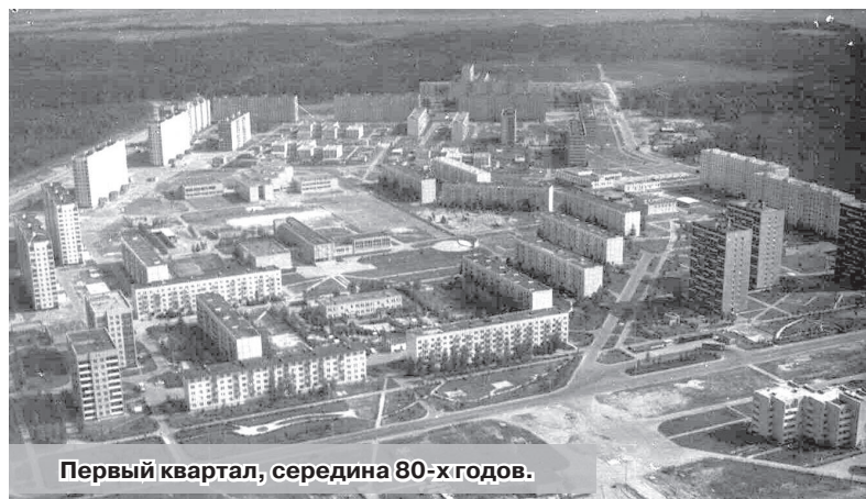
Первый квартал, середина 80-х годов.

К 90-м годам в рабочем посёлке Владимир-30 было всё необходимое для жизнедеятельности населения: жильё, работа, торговля, медицинское обслуживание, учреждения образования и культуры, транспортное обслуживание, почта, телеграф, сбербанк и многое другое. Почти полностью был застроен первый квартал города, велось активное строительство домов в третьем квартале. Градообразующее предприятие работало стабильно, и жители посёлка уверенно смотрели в будущее.