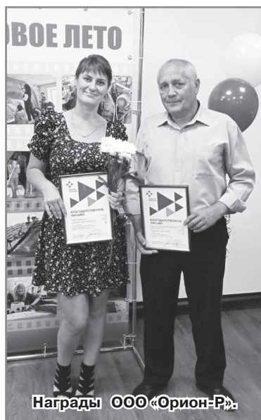
Награды ООО «Орион-Р».