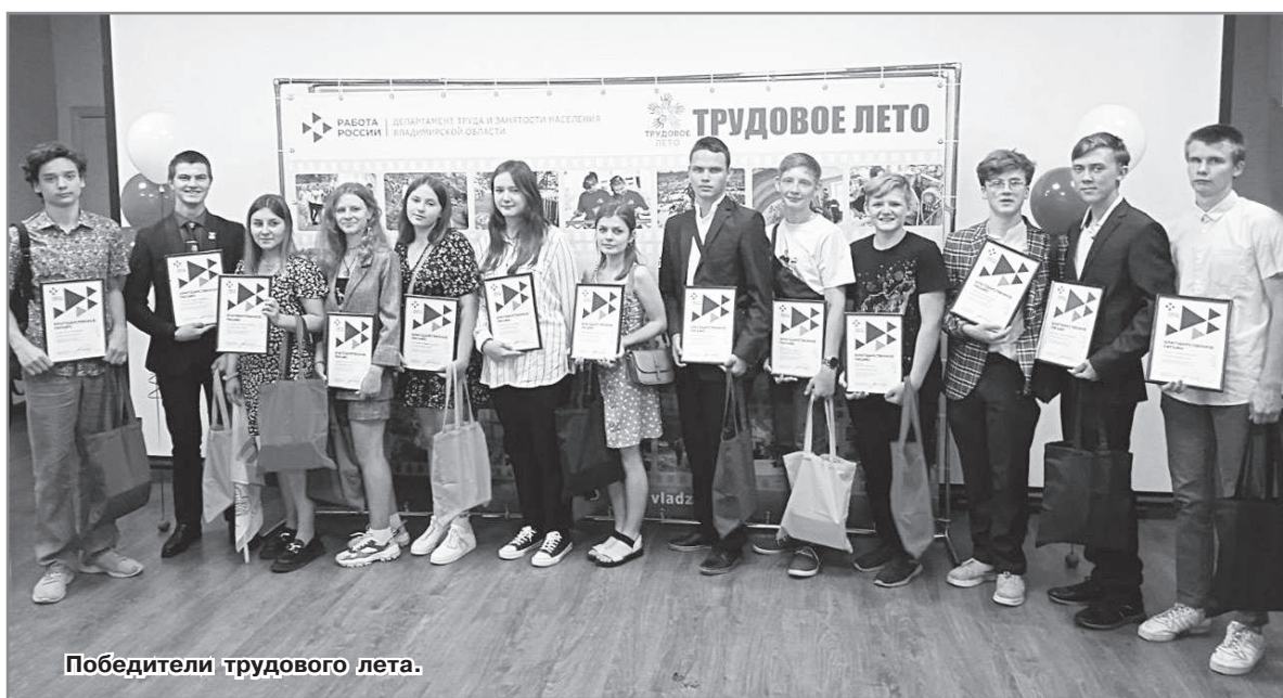
Победители трудового лета.