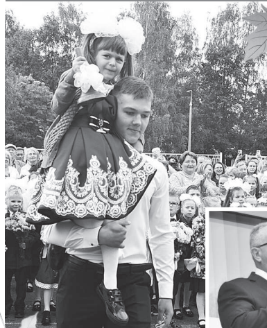
День знаний в первой школе

В школьном дворе, как говорится, «яблоку некуда упасть». Первоклашки - на почётном месте в первых рядах, а за ними учащиеся начальной школы и выпускники. Родственников, как обычно, больше, чем учащихся.