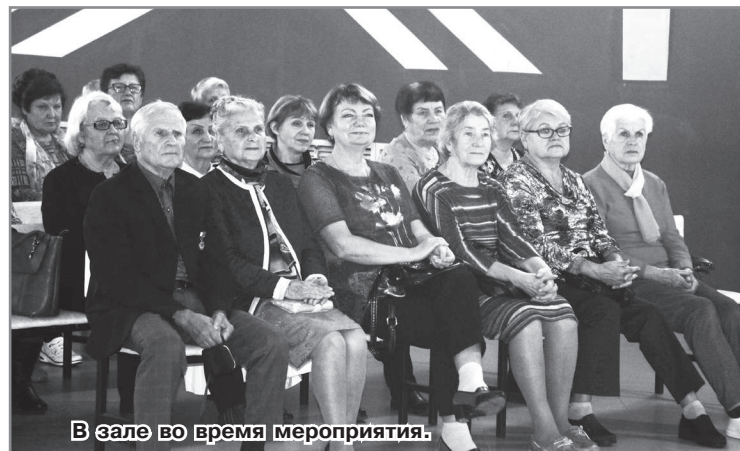
В зале во время мероприятия.