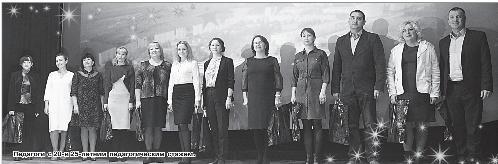
Педагоги с 20- и 25-летним педагогическим стажем.