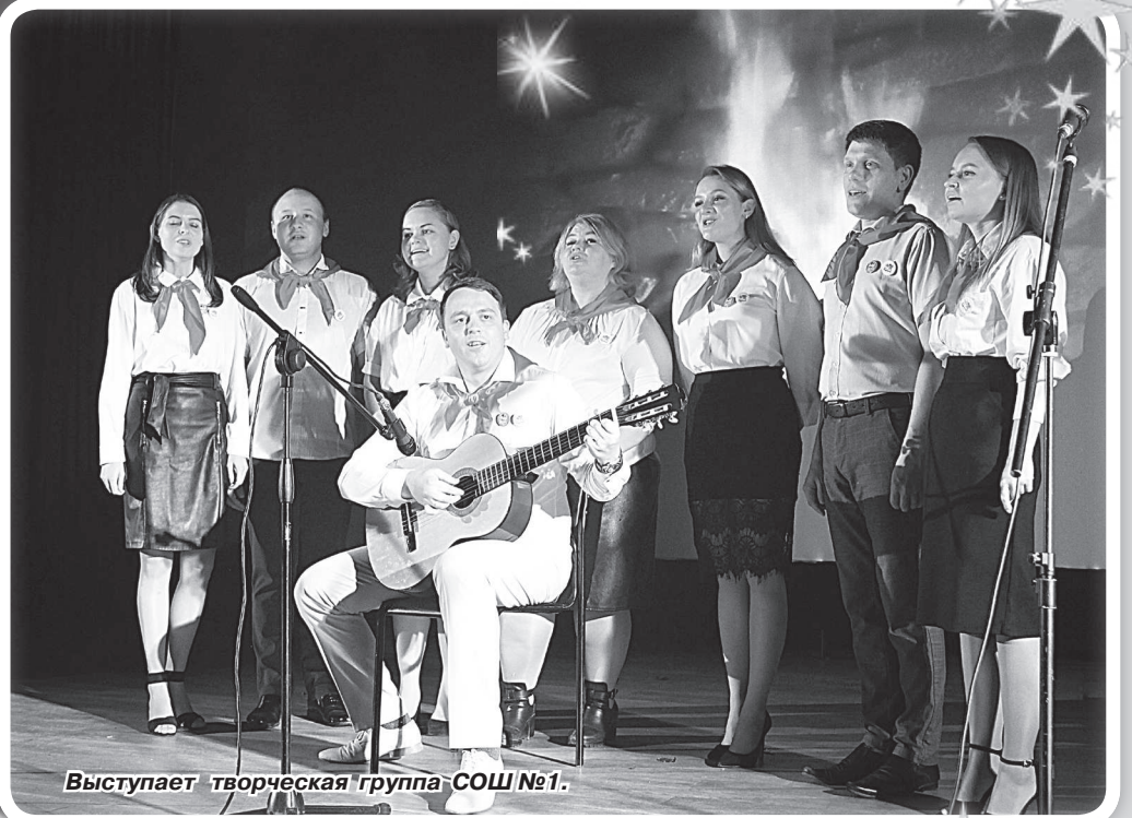
Выступает творческая группа СОШ №1.