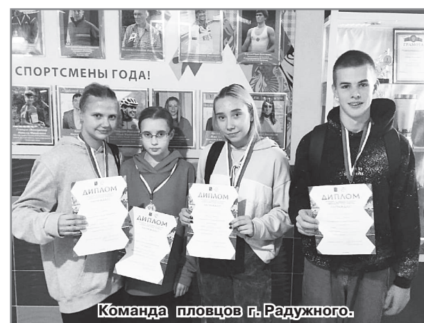
Команда пловцов г.Радужного.

Администрация ДЮСШ.