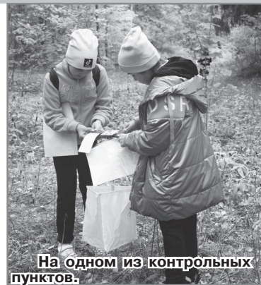
На одном из контрольных пунктов.