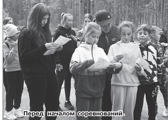
Перед началом соревнований.

Ежегодно 27 сентября отмечается Всемирный день туризма. В связи с этой датой, в пятницу, 30 сентября в Парке культуры и отдыха прошло открытое городское первенство по спортивному ориентированию среди учащихся СОШ №1 и СОШ №2.