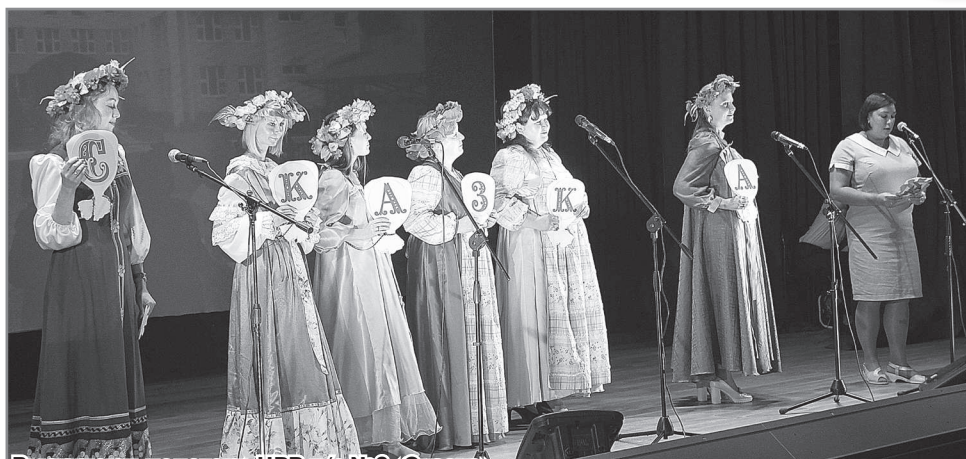
Выступают педагоги ЦРР д/с №6 «Сказка».

Этот фестиваль творчества, несомненно, станет