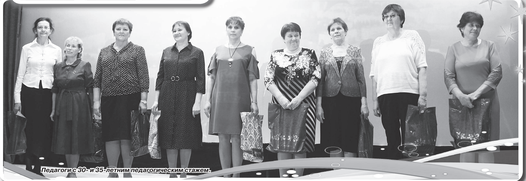
Педагоги с 30- и 35-летним педагогическим стажем.