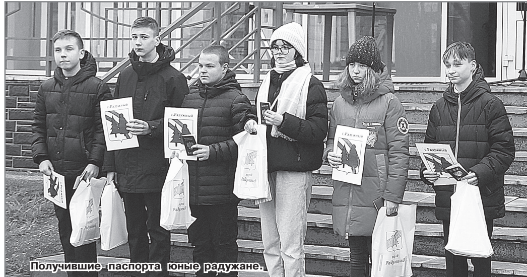
Получившие паспорта юные радужане.