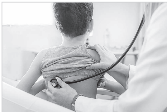
По информации городской больницы.

Объём исследований и осмотров включает: забор анализов, ЭКГ, флюорографию, УЗИ органов брюшной полости и сердца (по возрасту), осмотр врача - педиатра и врачей специалистов.