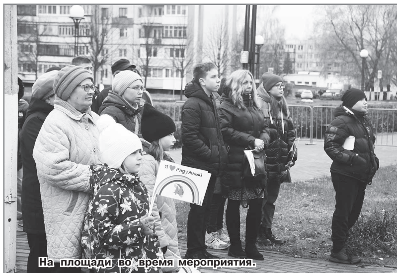
На площади во время мероприятия.