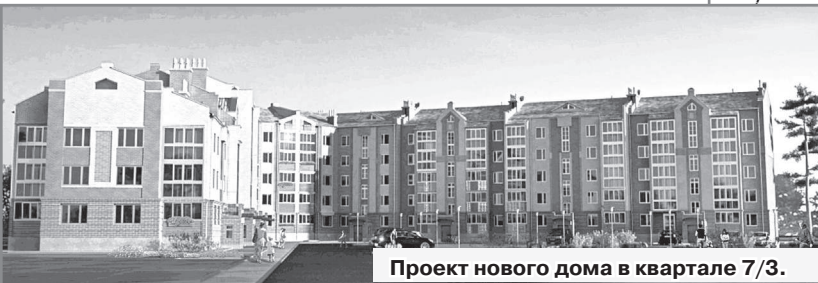
Проект нового дома в квартале 7/3.

Администрация города активно участвует в областных программах по финансированию обеспечения проектной документацией территориального планирования и проектов планировки территорий, а также строительства инженерных коммуникаций для малоэтажного жилищного строительства в квартале 7/1, в том числе, для обеспечения инженерной и транспортной инфраструктурой участков для многодетных семей.