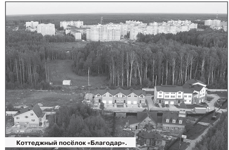
Коттеджный посёлок «Благодар».

работы в северной части города, в квартале 7/3. В соответствии с планировкой, разработанной проектным институтом «Владимир-гражданпроект» и утверждённым постановлением администрации ЗАТО г.Радужный в августе 2013г., под застройку планируется территория площадью 23 га. По периметру расположится усадебная жилая зона на 27 домов, внутри квартала – дома средней этажности (от 3-х до 5 этажей), это примерно 1400 квартир. В общей сложности здесь будут проживать более 4 000 человек. В центре квартала запланирована территория общего пользования: бульвары и скверы, здесь не предполагается движение транспорта. В восточной части