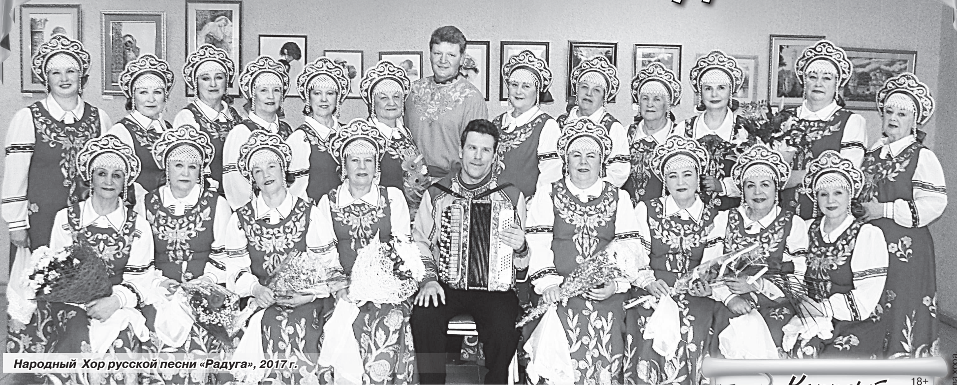
Народный Хор русской песни «Радуга», 2017 г.

Дорогие радужане! Нашему народному Хору русской песни «Радуга» в 2020 году исполнилось 40 лет. Мы тщательно готовились к этому событию, но, к сожалению, из-за пандемии пришлось отменить все праздничные мероприятия.