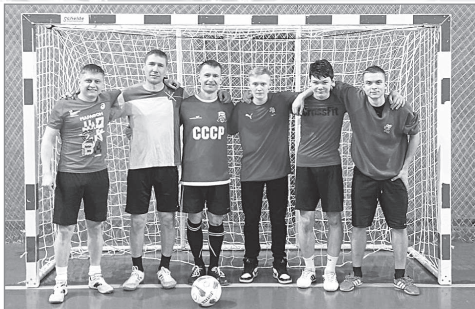
На фото команда «Союз».