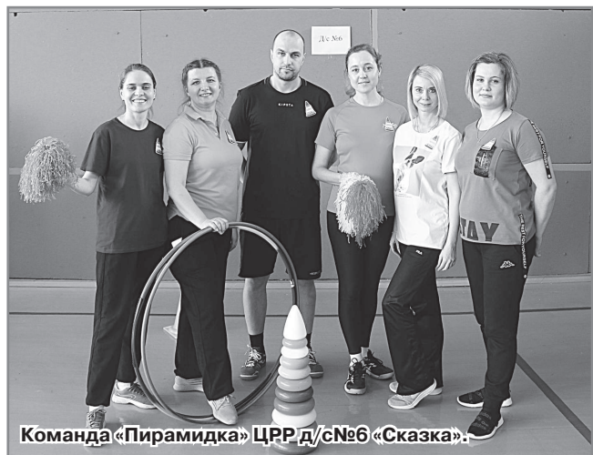
Команда «Пирамидка» ЦРР д/с№6 «Сказка».