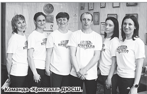
Команда «Кристалл» ДЮСШ.