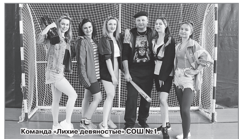
Команда «Лихие девяностые» СОШ№1.