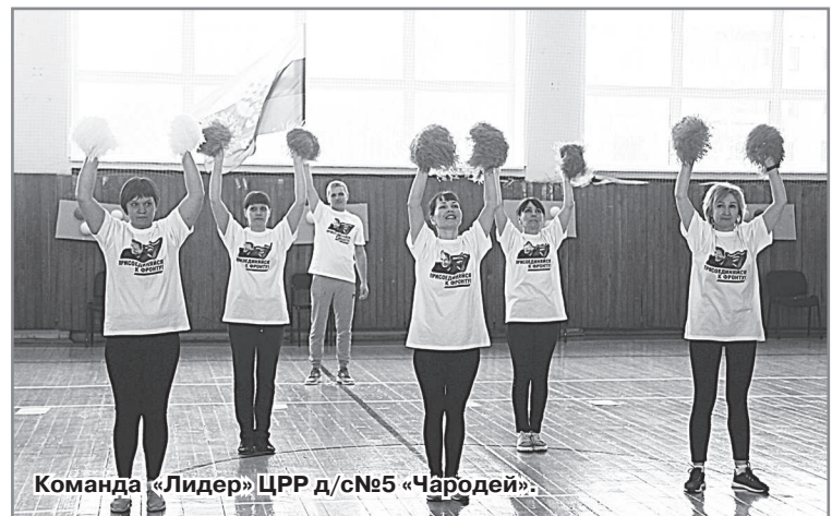
Команда «Лидер» ЦРР д/с№5 «Чародей».