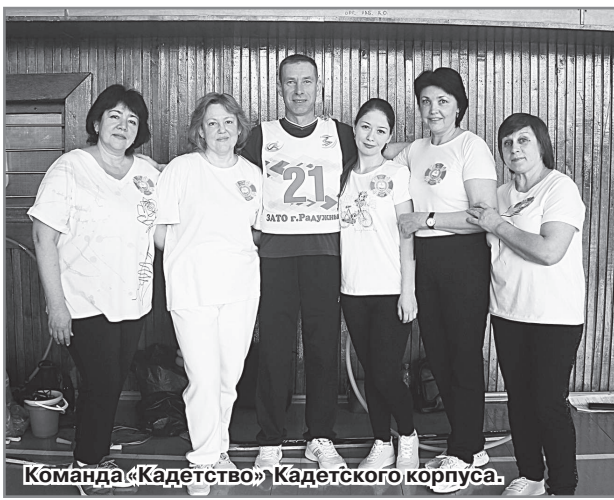
Команда «Кадетство» Кадетского корпуса.