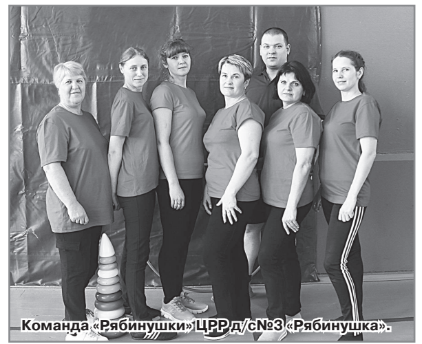
Команда «Рябинушки» ЦРР д/с№3 «Рябинушка».