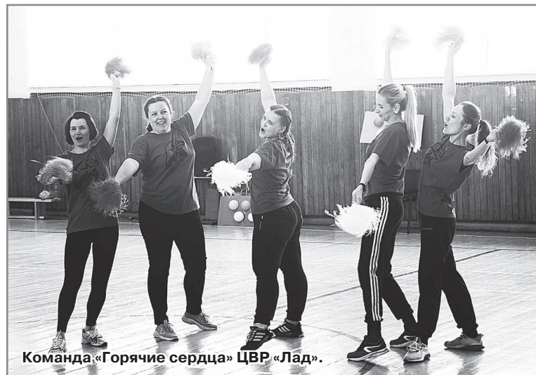
Команда «Горячие сердца» ЦВР «Лад».