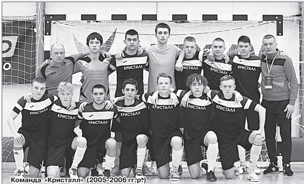
Команда «Кристалл» (2005-2006 гг.р.)