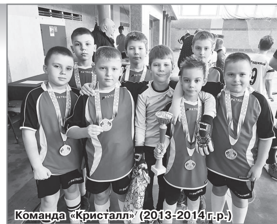
Команда «Кристалл» (2013-2014 гг.р.)

Хотелось бы отметить и поблагодарить родителей юных футболистов и болельщиков, которые на протяжении всего сезона активно поддерживали команды!