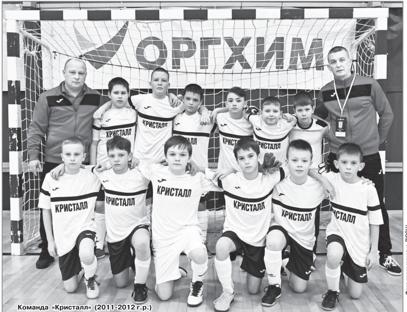
Команда «Кристалл» (2011-2012 г.р.)