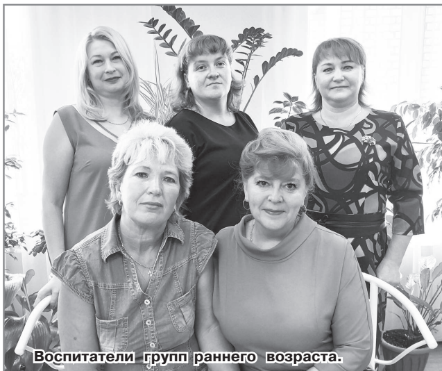
Воспитатели групп раннего возраста.

Когда адаптационный период завершён и дети привыкли к садику, важной задачей воспитателей