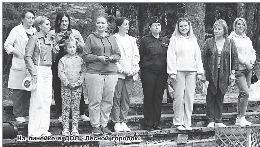
На линейке в ДОЛ «Лесной городок».

В среду, 21 июня в рамках акции «Лагерь – территория здоровья» специалисты службы профилактики навестили ребят, отдыхающих в ДОЛ «Лесной городок».