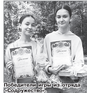
Победители игры из отряда «Содружество».