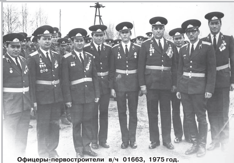
Офицеры-первостроители в/ч 01663, 1975 год.