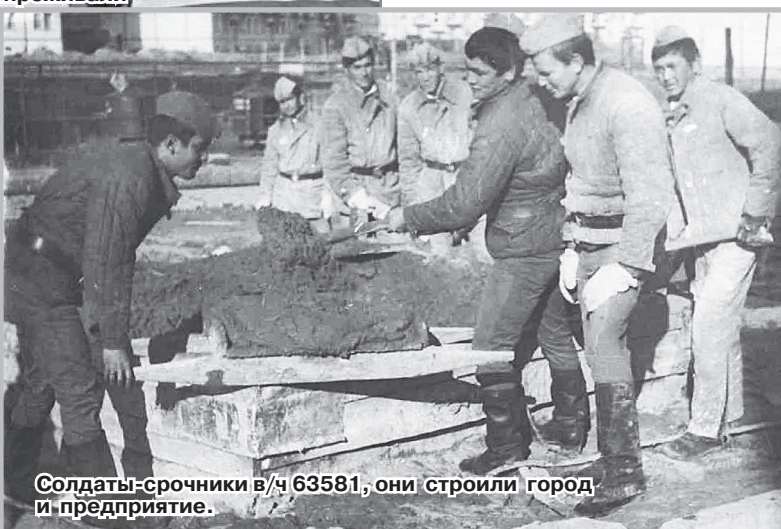
Солдаты-срочники в/ч 63581, они строили город и предприятие.