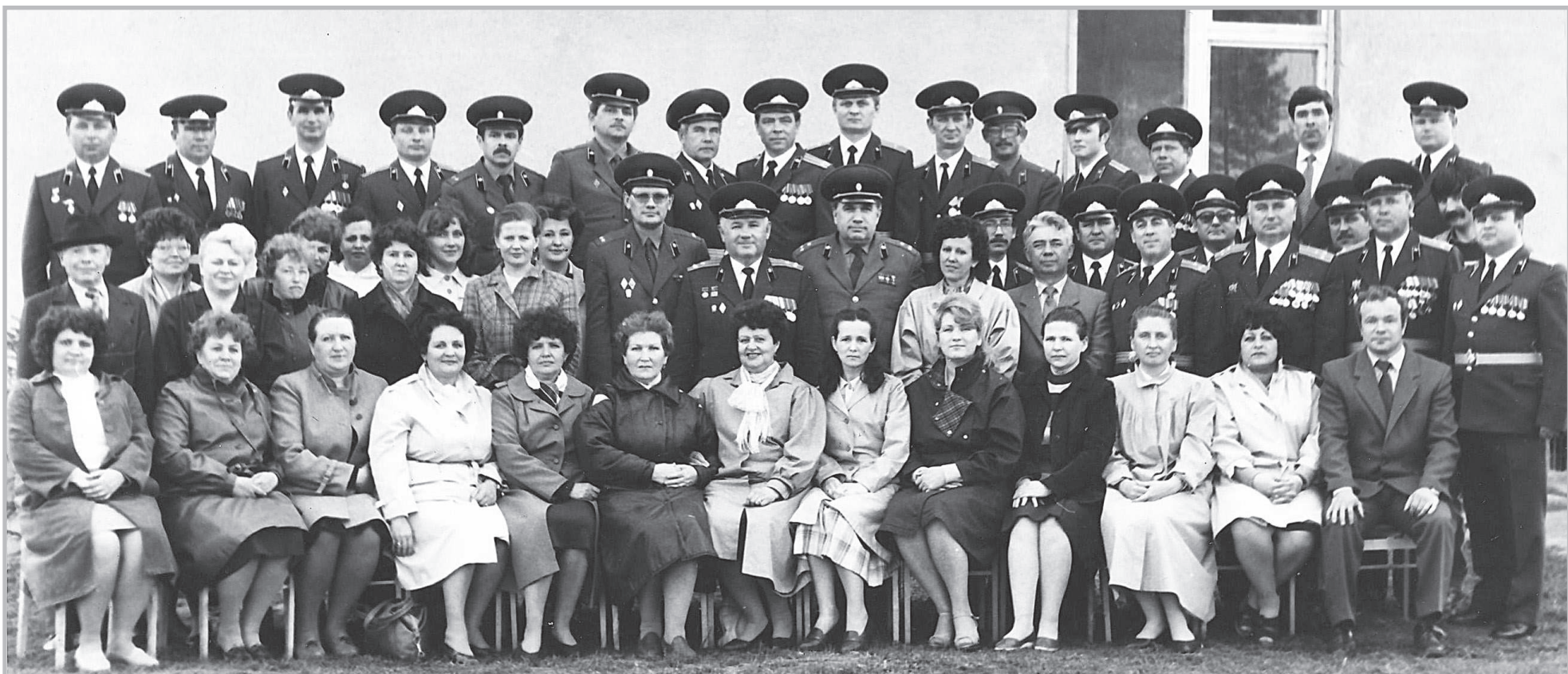
Вручение переходящего Красного знамени на 10-летие части, 1989 год.

Совет ветеранов военных строителей.