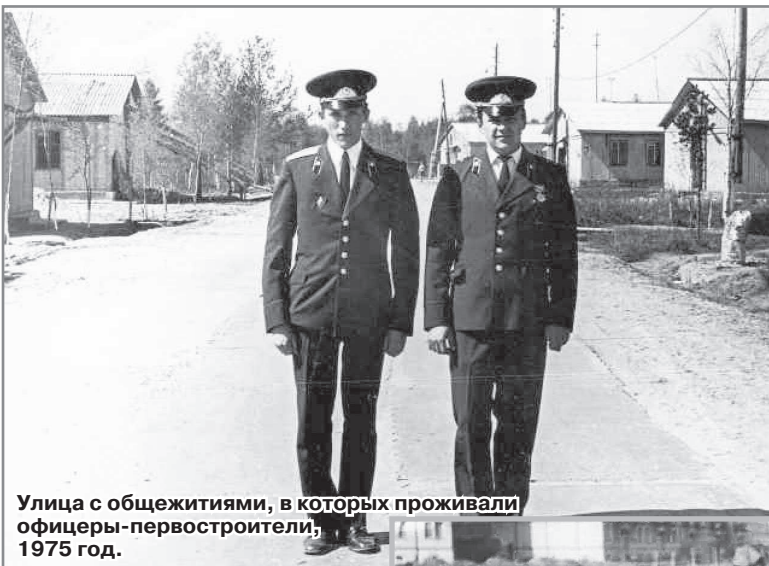
Улица с общежитиями, в которых проживали офицеры-первостроители, 1975 год.

Н.И. Бакумец, подполковник в отставке.