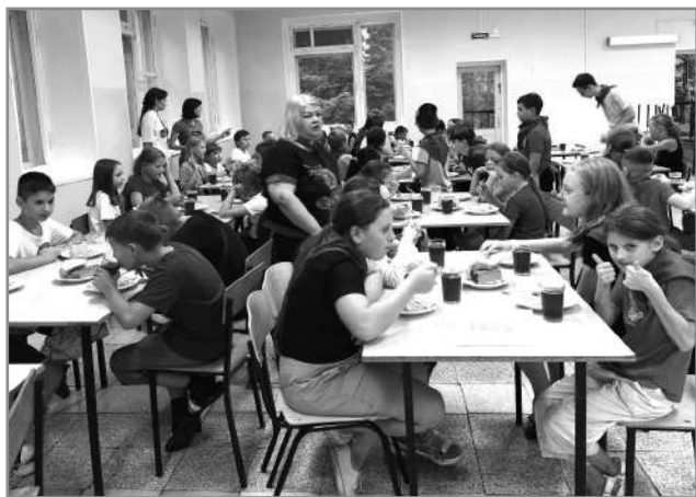
Открытие смены, дети шьют куклу-берегиню. Встреча детей на Владимирской земле.

В отряде «Волна» 20 ребят из Докучаевска, Донецка и Донецкой области.