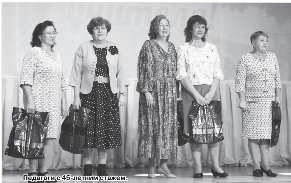
Педагоги с 45-летним стажем.