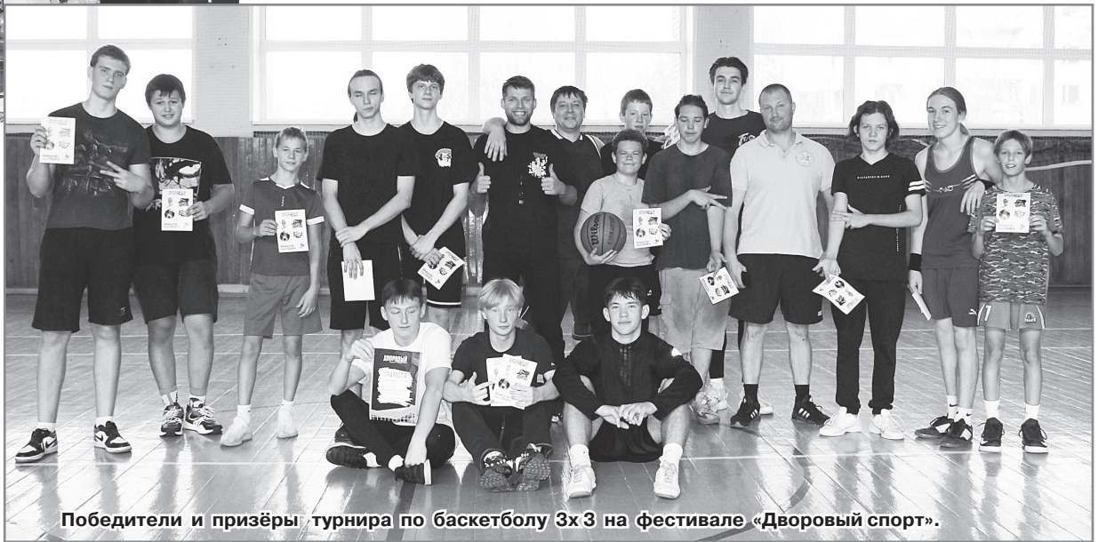
Победители и призёры турнира по баскетболу 3x3 на фестивале «Дворовый спорт».