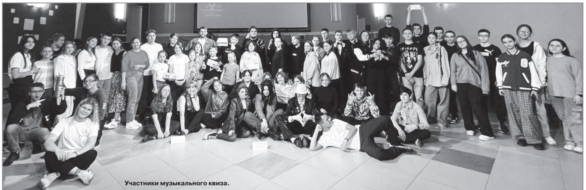
Участники музыкального квиза.

Отдел по молодёжной политике управления образования.