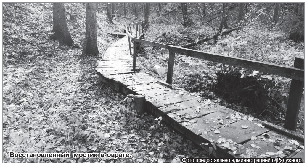
Восстановленный мостик в овраге.