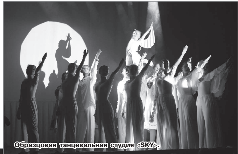
Образцовая танцевальная студия «SKY».

«Содружество» - красота, грация, четкость! Всегда поражает, как у них получается исполнять такие сложные композиции с легкостью и улыбкой.