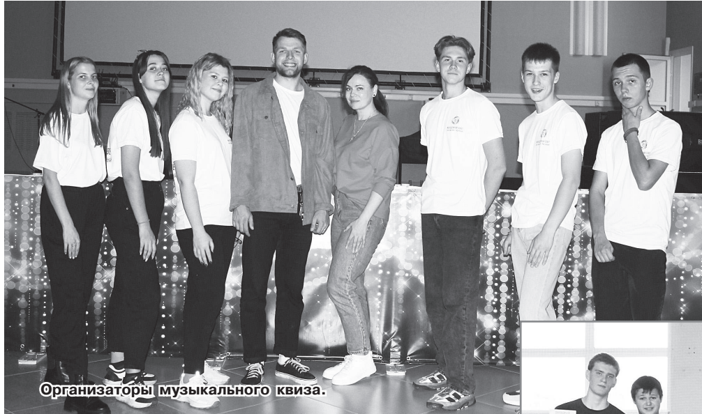
Организаторы музыкального квиза.

Отдел по молодёжной политике управления образования нашего города продолжает активную работу. Так, на прошлой неделе для молодёжи г.Радужного было проведено сразу два больших интересных, захватывающих мероприятия: музыкальный квиз и фестиваль «Дворовый спорт».