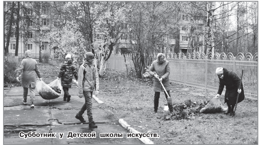
Субботник у Детской школы искусств.