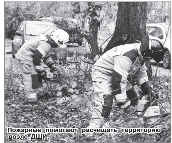
Пожарные помогают расчищать территорию возле ДШИ.