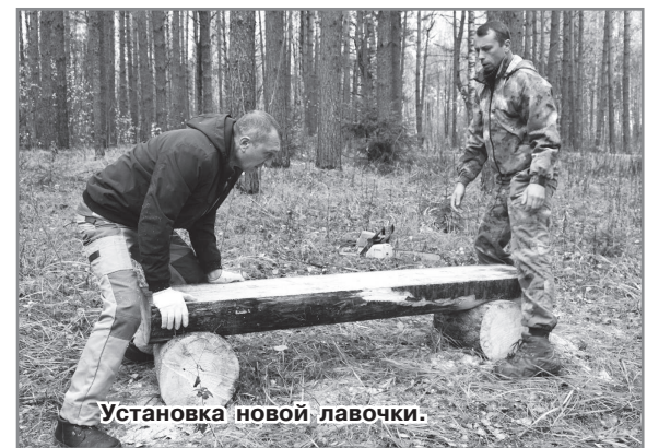
Установка новой лавочки.