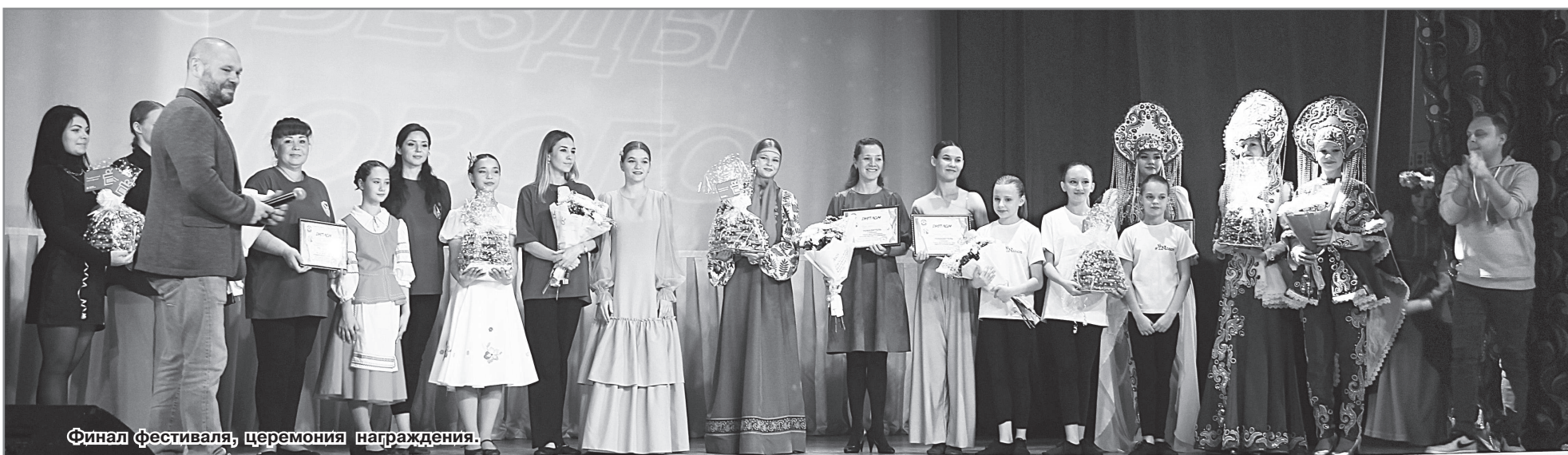
Финал фестиваля, церемония награждения.