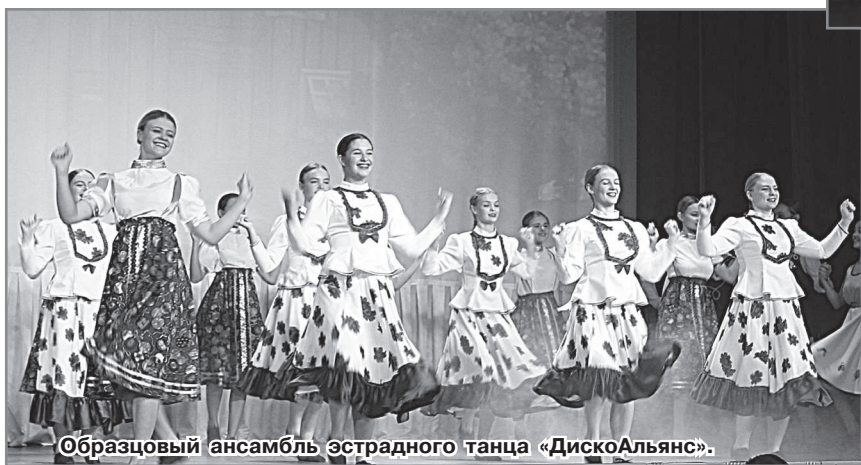
Образцовый ансамбль эстрадного танца «ДискоАльянс».

Хореографы, сочинившие танцевальные композиции на заданную тему, и юные исполнители, воплотившие задуманное – все были на высоте. Уверена, что нашим коллективам вообще по силам любая задача, подтверждением этому