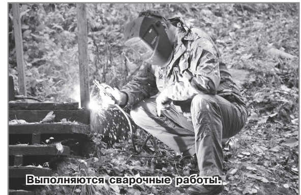
Выполняются сварочные работы.