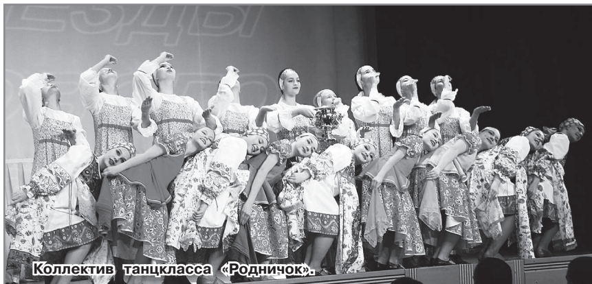
Коллектив танцкласса «Родничок».