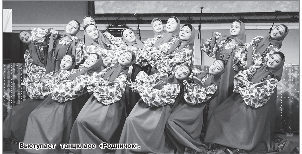
Выступает танцкласс «Родничок».