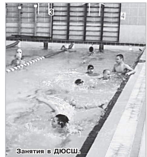
Занятия в ДЮСШ.

В лагере дети усердно тренировались и готовились к предстоящим спортивным соревнованиям. Они проводили время в лагере с пользой, отработывая новые навыки и совершенствуя свои умения. Несмотря на плотный график тренировок, ребята играли в спортивные игры – футбол, баскетбол, настольный теннис, а борцы могли прийти поплавать в бассейне. 30 октября оба отряда приняли участие в празднично-спортивном мероприятии, посвященном Дню тренера. В заключительный день были проведены командные эстафеты, и каждый ребенок получил сладкий подарок. Осенний спортивный лагерь стал для детей отличным способом провести каникулы с пользой и удовольствием.