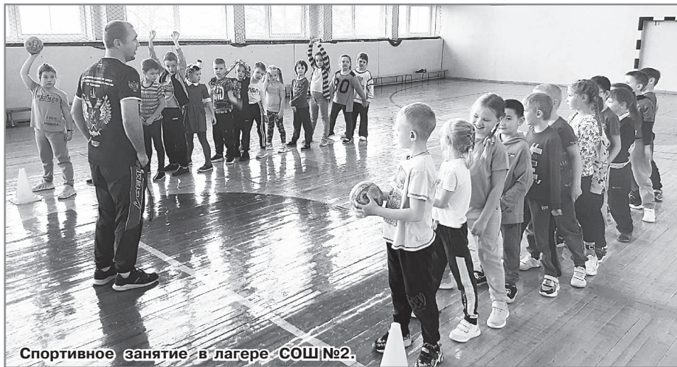
Спортивное занятие в лагере СОШ №2.

Школа благодарит ребят за их активность и с нетерпением ждет новой лагерной смены.