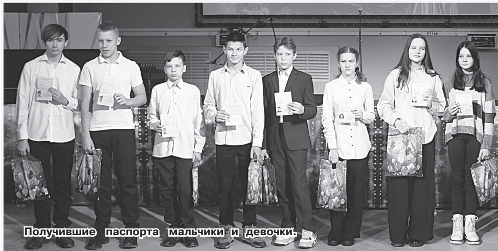
Получившие паспорта мальчики и девочки.