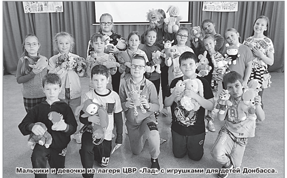
Мальчики и девочки из лагеря ЦВР «Лад» с игрушками для детей Донбасса.

Не обошли нас стороной и познавательные встречи, подготовленные сотрудниками Общедоступной библиотеки. А как запомни-