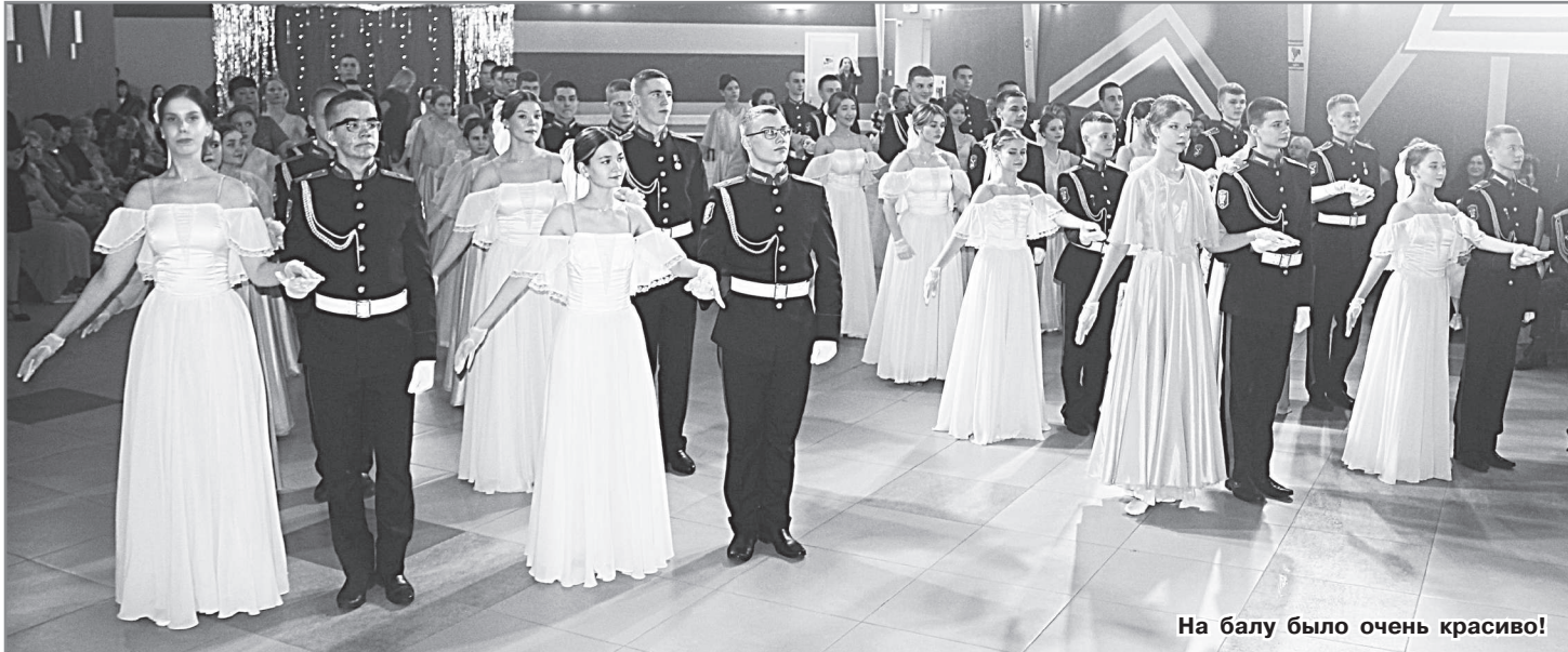
На балу было очень красиво!