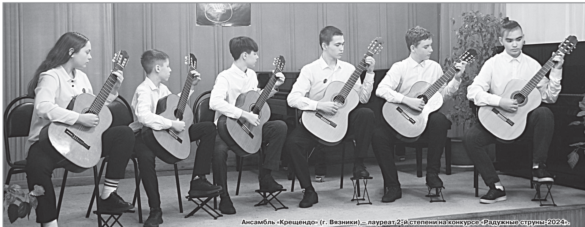
Ансамбль «Крепсцендо» (г. Вязники) – лауреат 2-й степени на конкурсе «Радужные струны-2024».

Детская школа искусств г. Радужного 24 января вот уже в 25-й раз открыла свои двери для участников областного открытого конкурса юных гитаристов «Радужные струны». Это стало одним из главных событий культурной жизни города в начале 2024 года.