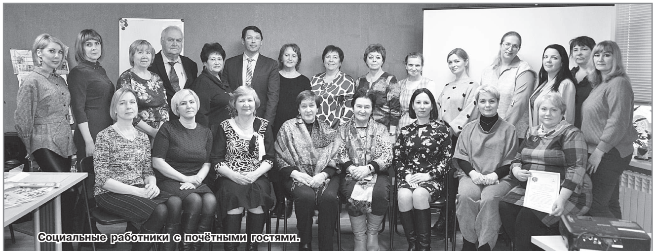
Социальные работники с почётными гостями.

За 2023 год учреждением было обслужено более 4000 человек, социально-реабилитационной работой охвачены более 2000 несовершеннолетних детей. Семейный многофункциональный центр, который был открыт в 2022 году, продолжил оказывать многопрофильную помощь семьям с детьми, оказавшимся в различных жизненных ситуациях. Продолжена работа Центра помощи семьям мобилизованных. В усиленном формате работало стационарное отделение,