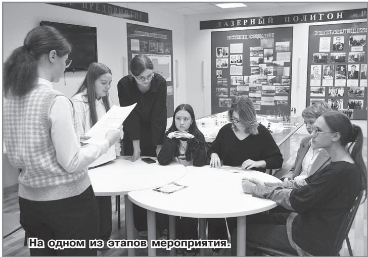
На одном из этапов мероприятия.