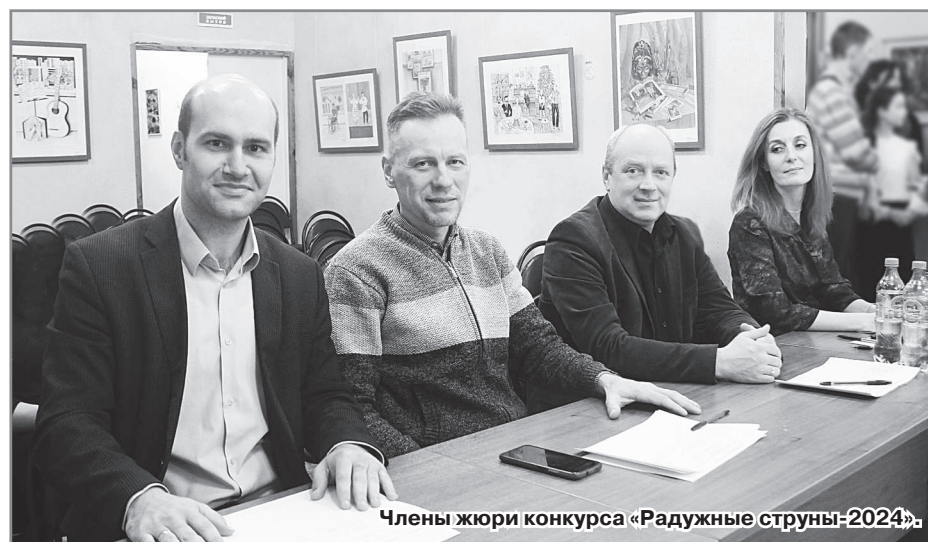
Члены жюри конкурса «Радужные струны-2024».