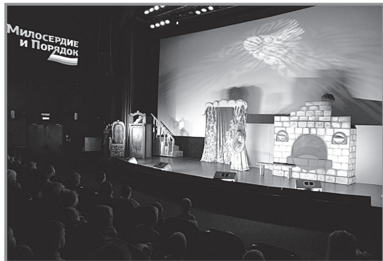
В новогодних мероприятиях приняли участие несколько тысяч детей региона.

Пресс-служба ВПОО «Милосердие и порядок».