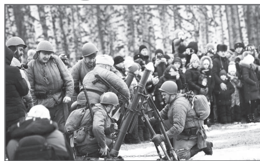
На тактическом полигоне в районе деревни Сергейцево 18 января прошла военно-историческая реконструкция боя 1944 года «Первый Сталинский удар».

Военно-историческая реконструкция - ещё один «бой»!